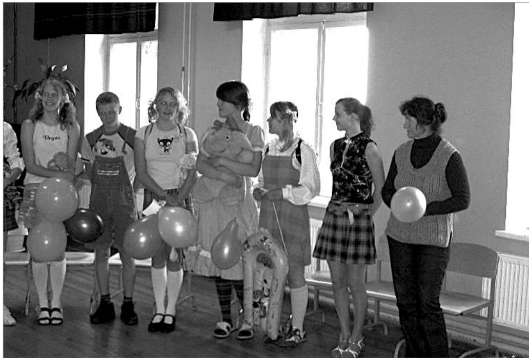
TUTIPÄEV: viimasel koolipäeval sai lõpmata palju nalja.