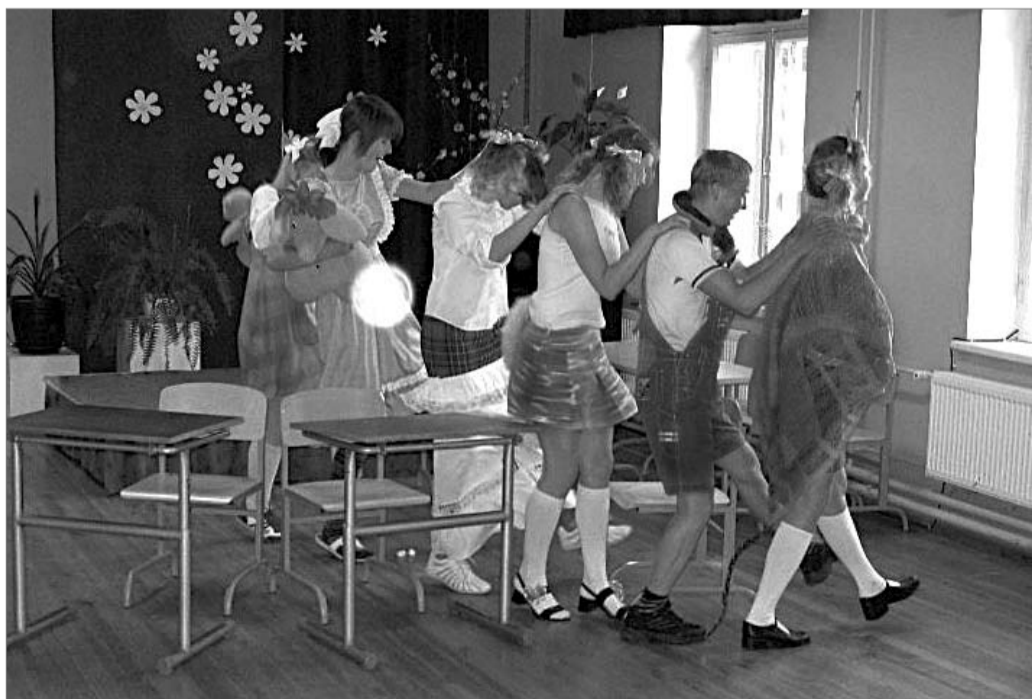
... ja veel.