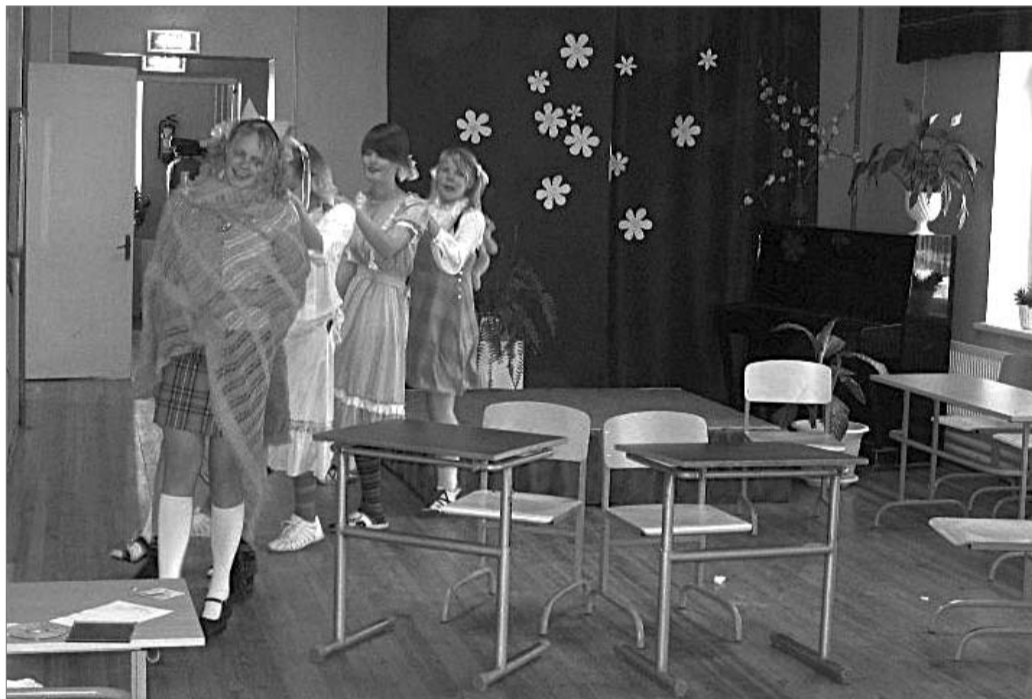
Ja siis sai veel,