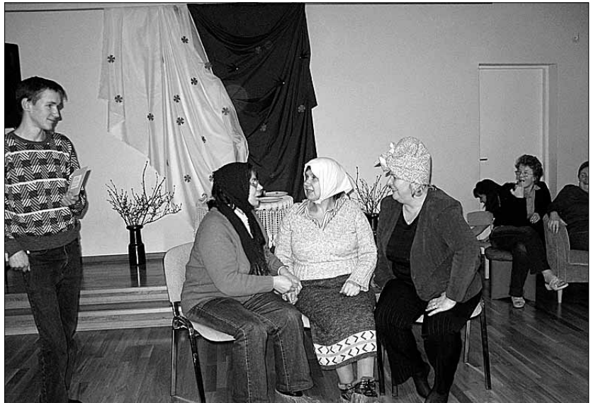
• Raamatukogude võistkond esitab anekdooti.

Ega üritus ainult ajude ragistamisega piirdunud. Maitsti rahvuslikke toite, näideldi etteantud anekdoodi põhjal ja vaadati lasteaiarahva etendatud näitemängu. Majaperenaine usub, et üritusest, mis seekord oli kantud vabariigi 90. sünnipäeva mõttest, saab traditsioon. Maret Lina