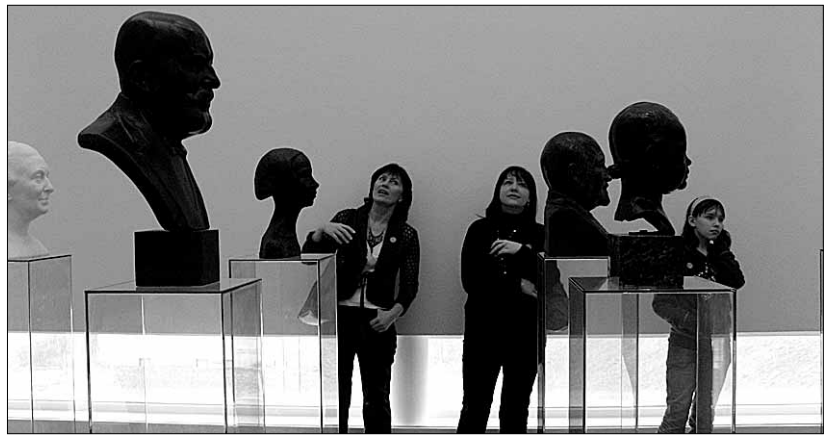
● Lasteaednikud uudistavad KUMU väljapanekuid.