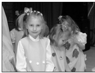
Muusikapidu Murumunas. Lk 3