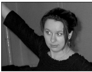
Tartlanna Merit Kanneli tantsulapsed on juba edukad ka rahvusvahelistel konkurssidel. Lk 2