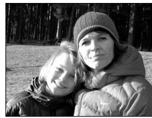
Seekordne juubilar tahtis juba esimeses klassis tree-neriks saada. Lk 5