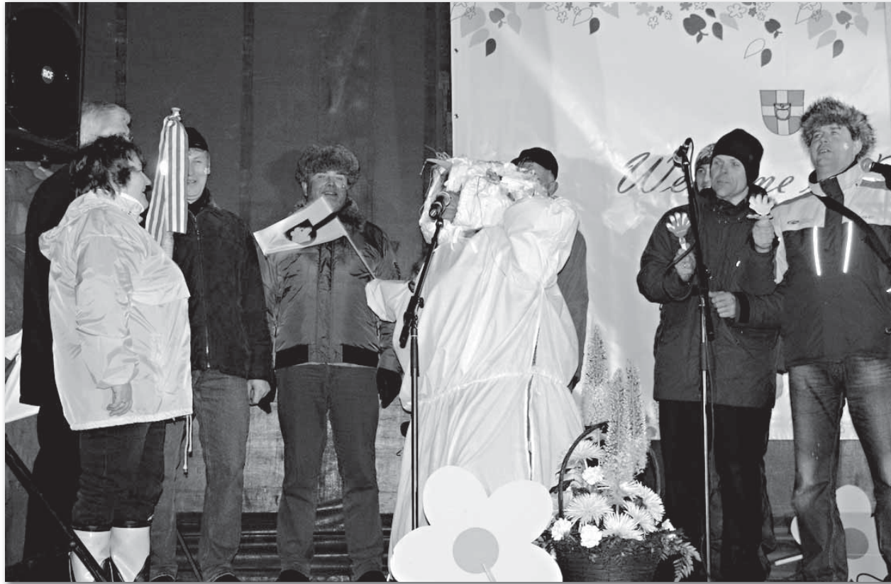
Talvepealinnast Otepäält jõudis Türi kevadet tervitama ka lumememm.

Tippujujud läbisid ööpäevaga 106 350 meetrit. Eesmärk oli läbida ööpäevaga 100 kilomeetrit tähistamaks sellega 100. aastat sportlikku ujumist Eestis. Ujumisüritus "Ujudes keva-