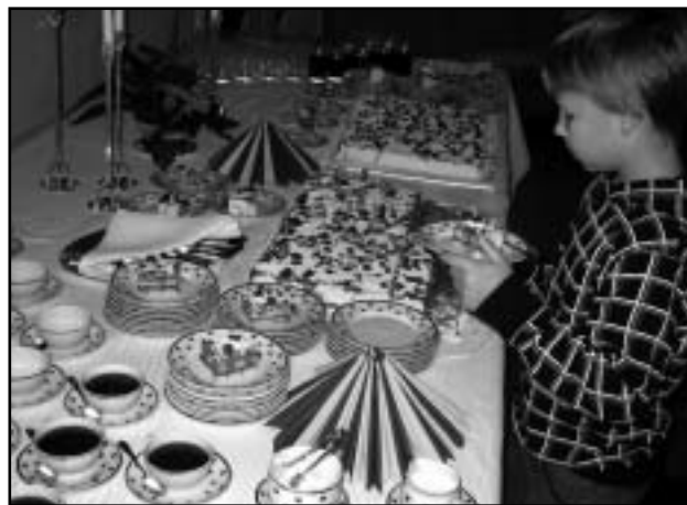
Tortidel ilutsesid Rootsi lipukesed.