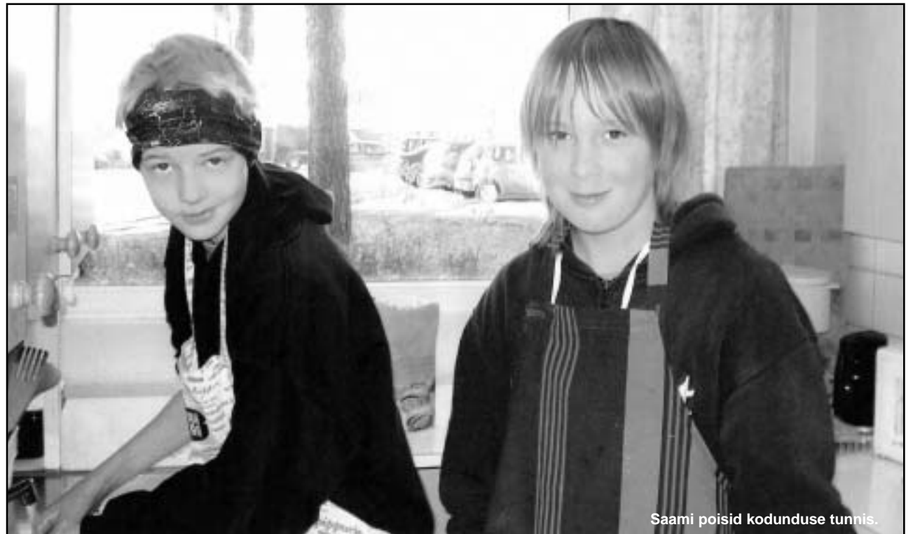
Saami poisid kodunduse tunnis.