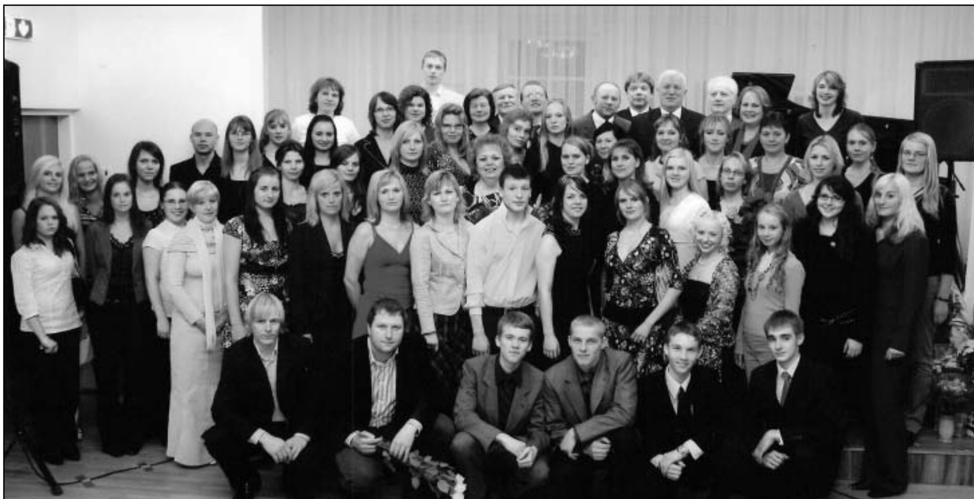
Muusikakooli vilistlased, endised ja praegused õpetajad, ning vallajuhid.