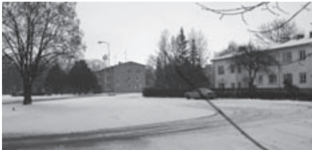
Linna parklates õhtuti kogunevad noortekambad teevad komisjonile tõsist muret.