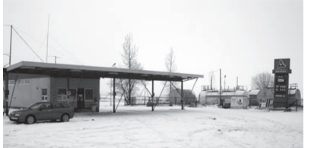
Kuigi tanklahoone on hetkel veel alles, on siin öösiti inimeste ja pime. See teeb kohalikele inimestele muret.

Loodavale tehnokülale mõeldes oleks võinud üks