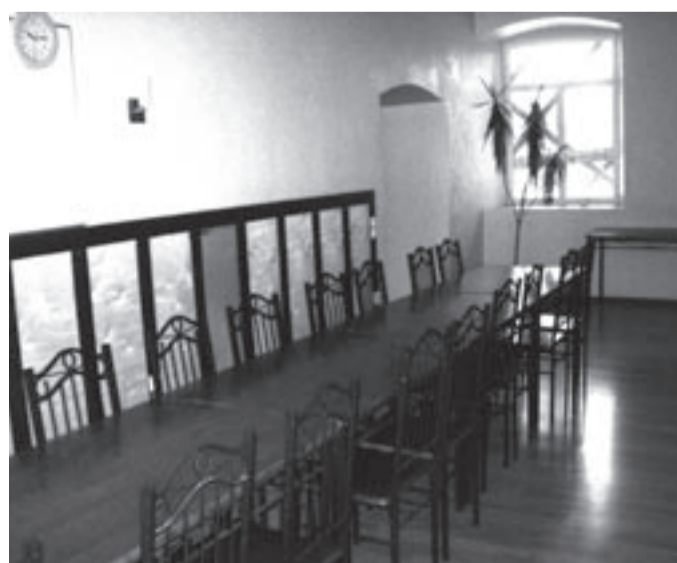
Avar peosaal sobib nii pidude kui ka konverentside pidamiseks.