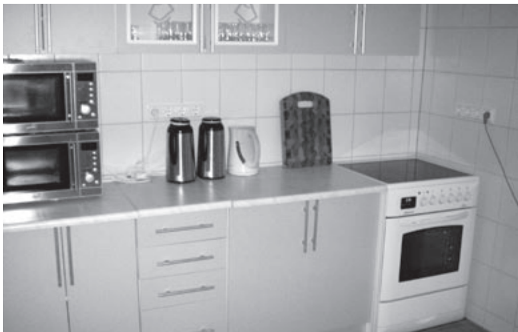
Tulevikus on plaanis toitlustusteenust ka kohapeal pakkuda. Selleks on välja ehitatud korralik ja kaasaegne köök.

Tegelikult pole perenaine veel päris kindel, kas külalistemaja igavesti tegutsema jääb. Seda näitab aeg, mis tuleb ja mis jääb. Ta mõlgutab mõtteid, et võib-olla muudab ta külalistemaja kord söögi-kohaks ümber. Maantee käib ju sealtsamast mööda ja sellel liigub tihedasti masinad.