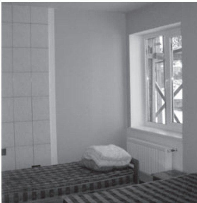
Ööbimiseks mõeldud toad on üsna lihtsa interjööriaga.