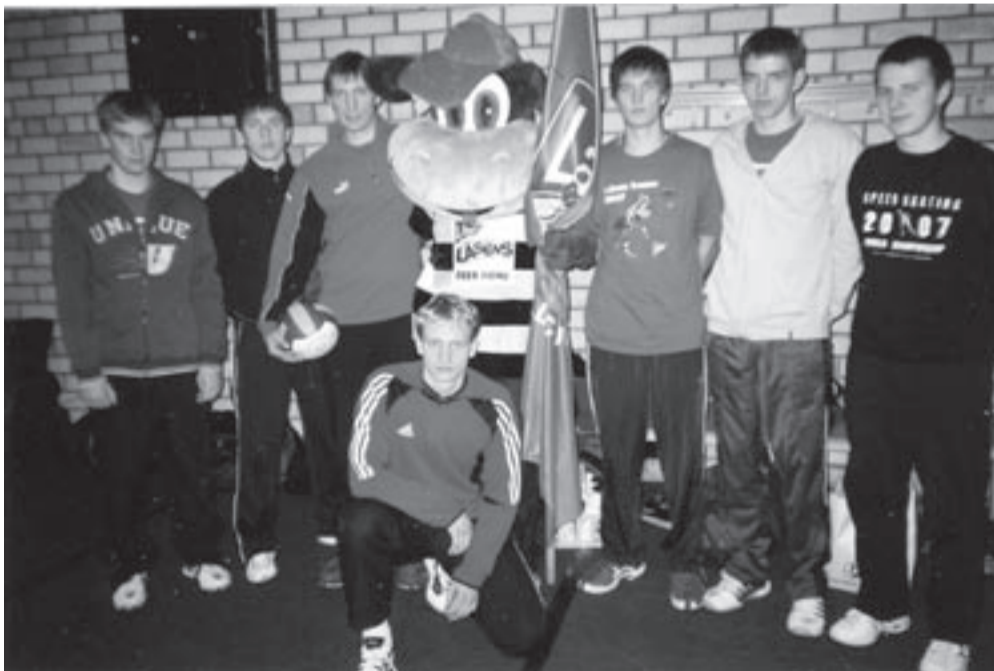
Põltsamaa spordikooli võrkpalluridki otsustasid Riias toimunud võrkpallivõistluste maskotiga ühise pildi mälestuseks jäädvustada.

33 võistkonda paigutati Riias kaheksasse alagruppi. Põltsamaa võrkpallipoisid mängisid alagrupiturniiril hästi, kuid jäid siiski teiseks. See tähendas aga automaatselt, et kohamänge tuli mängida üheksandast kuni kuueteistkümnenda kohani. "Alagrupivõidu sai Riia Põllumajandusülikooli võistkond, kellele me ei oleks mitte mingi valemiga vastu