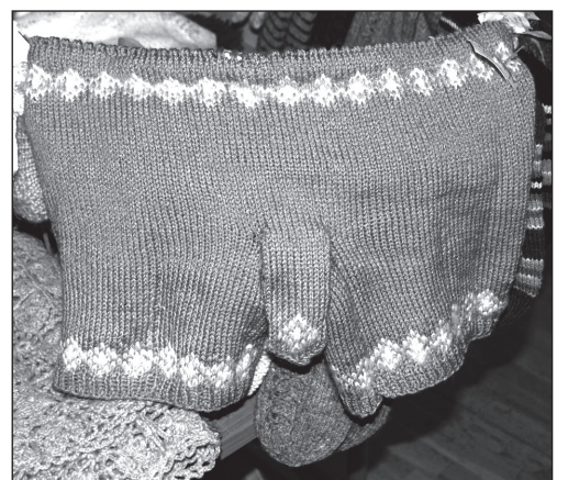
NUTOVI MIRJAMI PILT