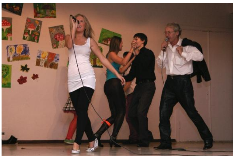
Meribel 10. r-st laulis duetti kooli elektrik Endliga

töestasid veel oma kokakunstioskust, tehes 12.a-le erinevaid küpsetisi. Pärast vahetundidel võistu pingutamist tuli ennast tõestada nädala viimasel päeval, reedel, pannes välja kogu loome-võimekuse.