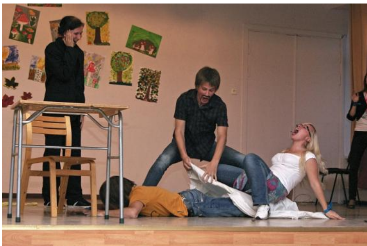
10.a näidend “Ladina-Ameerika seep. Reklaamipaus, seep” üllatas ootamatu lõpuga.

Kolmapäeval oli stiiliks “Maffia ja glamuur”. Korraldati 12.a-teemaline viktoriin ning võimlas söödi püksipiirkonnast võidu porgandit. “Jumalate” kõhutäie eest hoolitses 10.c.