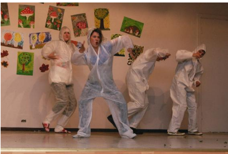
10.c imiteeris playback’is tondipüüdjad

Viimasel päeval tuli ennast riietada kõögiviljadeks. Tehti kompotti ehk iga klass pidi tegema punkti ja jooksmas selles üle saali ringi ning laulma. Toitu tegid kõik! Isegi 12.a hoolitses, et rebastele jaguks sibulat, küüslauku, kalamaksaõli, mädarõigast, leiba ja