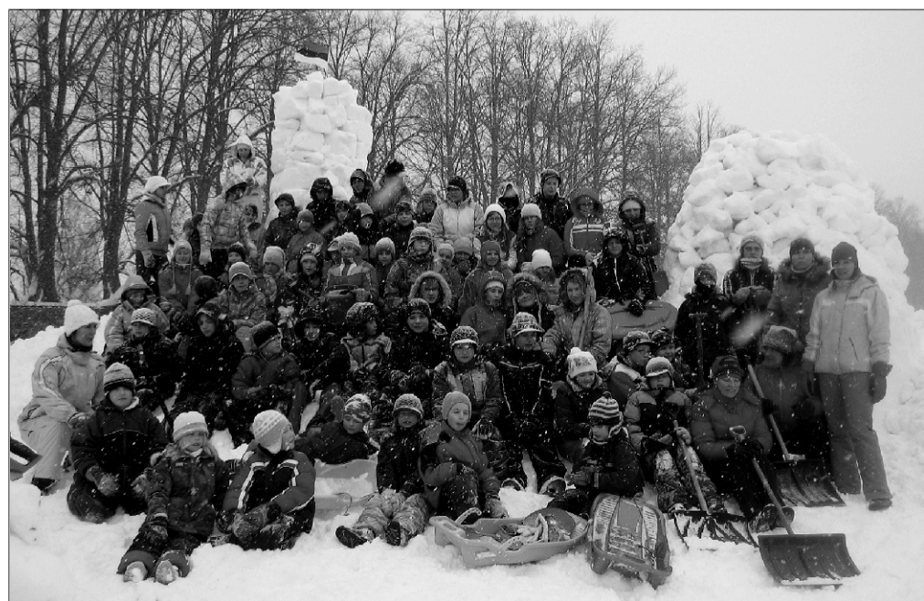
Lumelinna ehitajad „Toompeal“