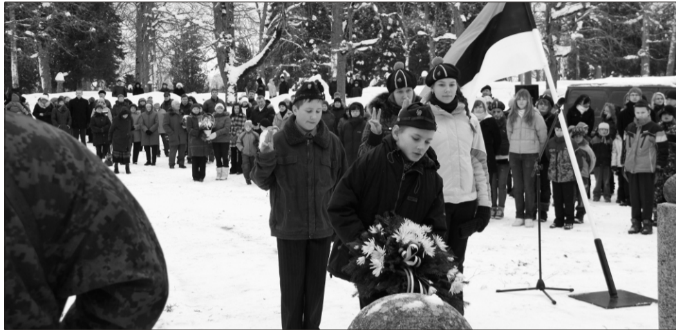
Iseseisvuspäeva aktus 24. veebruaril Lembitu ausamba juures