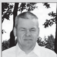
nr. 118 Anti Kulasalu