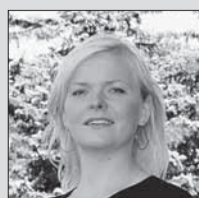
nr. 121 Aile Viks