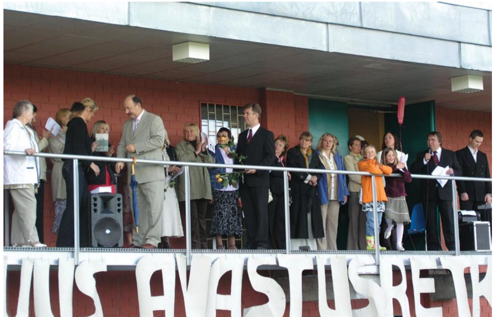
Koolijuhid ja vallajuhid avaaktusel tervitusi üle andmas.