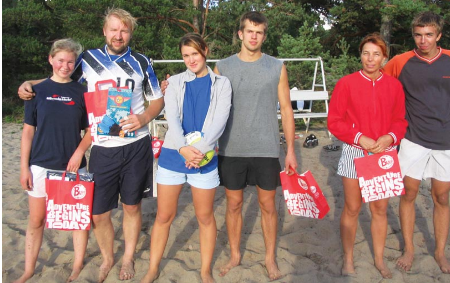
Valla parimad segapaarid rannavolles.

Kutsume kõiki 18. septembril kell 18.00 Kullo Lastegaleriise Kuninga tn 6 pilku heitma Harku valla laste ja noorte tööde näitusele