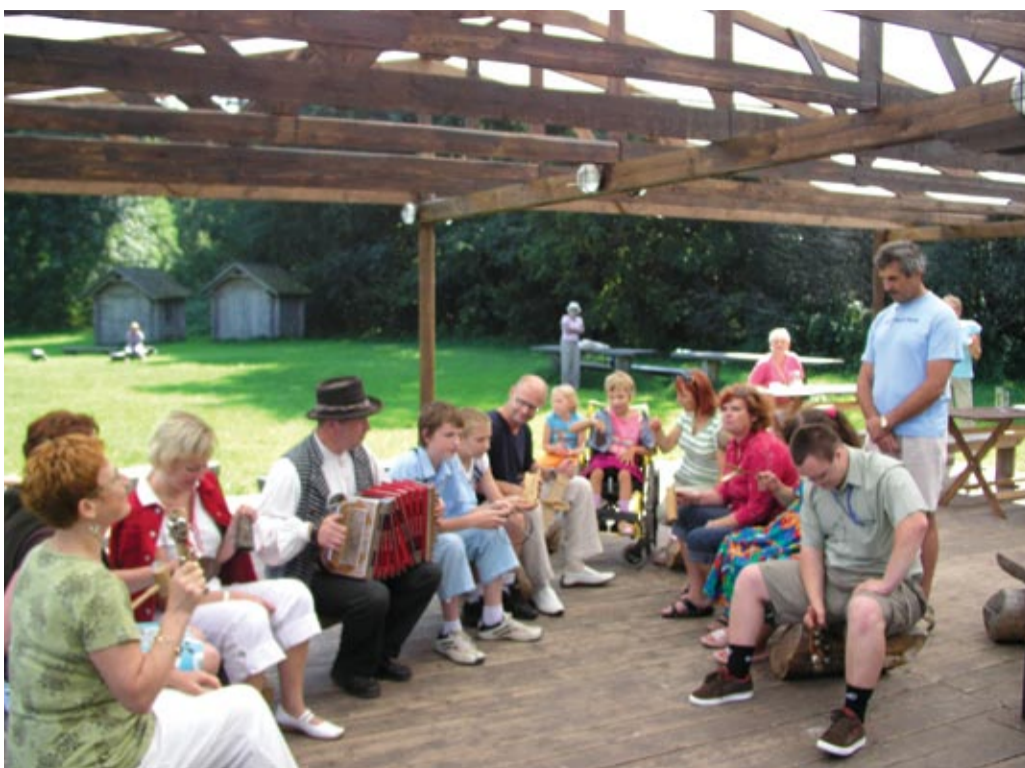
Soome-eesti ühisansambli osalesid nii suured kui väikesed.