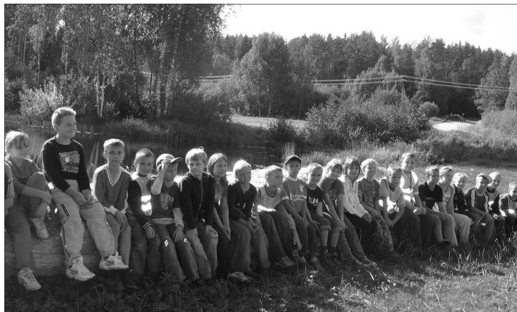
Tääksi kooli lapsed looduses