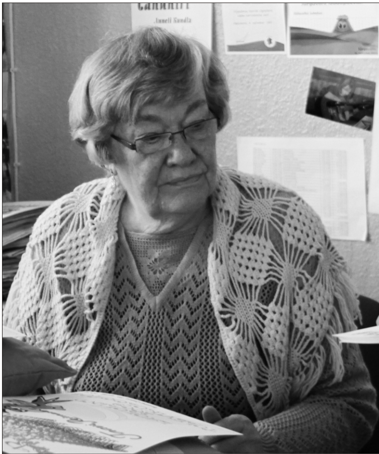
2009. aasta aprillis - Endla on tulnud appi laulukonkursi Laululind diplomeid kirjutama