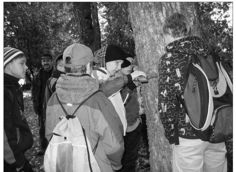
Poisid puud mõõtas