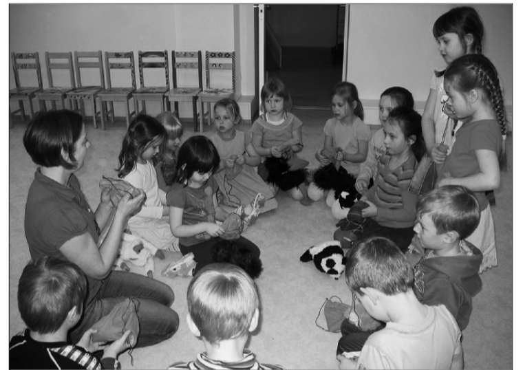
Sipsikud loodust tunnetamas