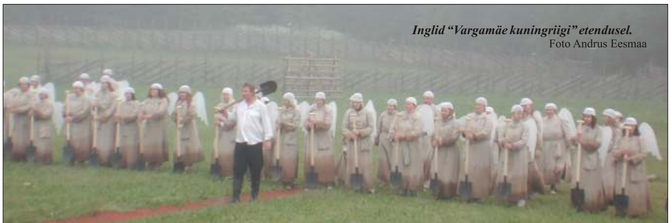
Inglid “Vargamäe kuningriigi” etendusel.