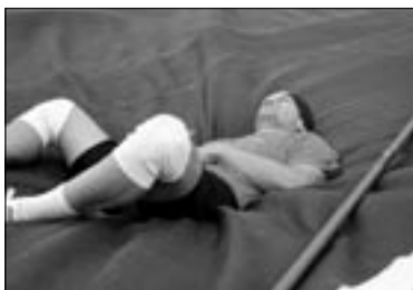
Kümnevõistlus Haapsalus Juba kaheksandat korda toimus Falcki juhtide kümnevõistlus Haapsalu linna staadionil. Sellest ja teistest spordiüritustest loe lk 7