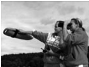
Randades selleks aastaks punane lipp Ülevaadet äsja lõppenud rannahooajast loe lk 3