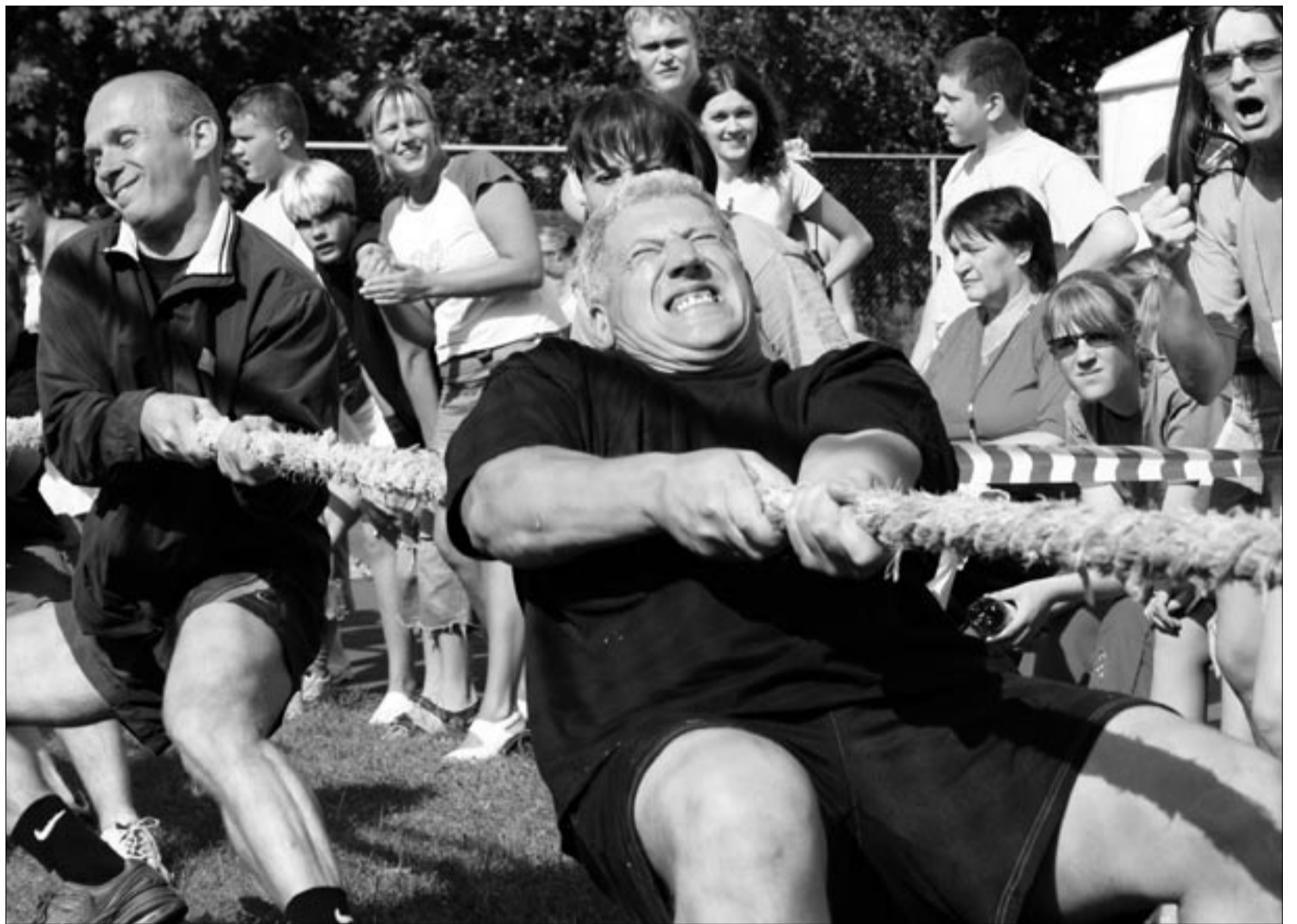
KONKURENTS VIIB EDASI. Kõva rebimine paremate positsioonide pärast käib nii turvaturul kui ka Falckis sees. Sellise pingutusega püüdsid Ida regiooni piraadid suvepäevadel end kõrgemale kohale vedada. Suvepäevadest loe lähemalt lk 4-5.