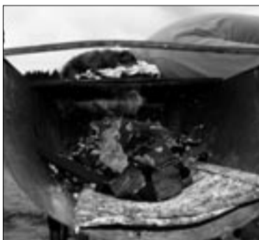
Suvepäevad – merepäevad – traditsioon mis jätkub, jätkub... Traditsiooniliselt spordirohketest suve(mere)päevadest teeb sõnas ja pildid kokkuvõtte Falck Eesti infojuht Andres Putting. Loe lk 4-5