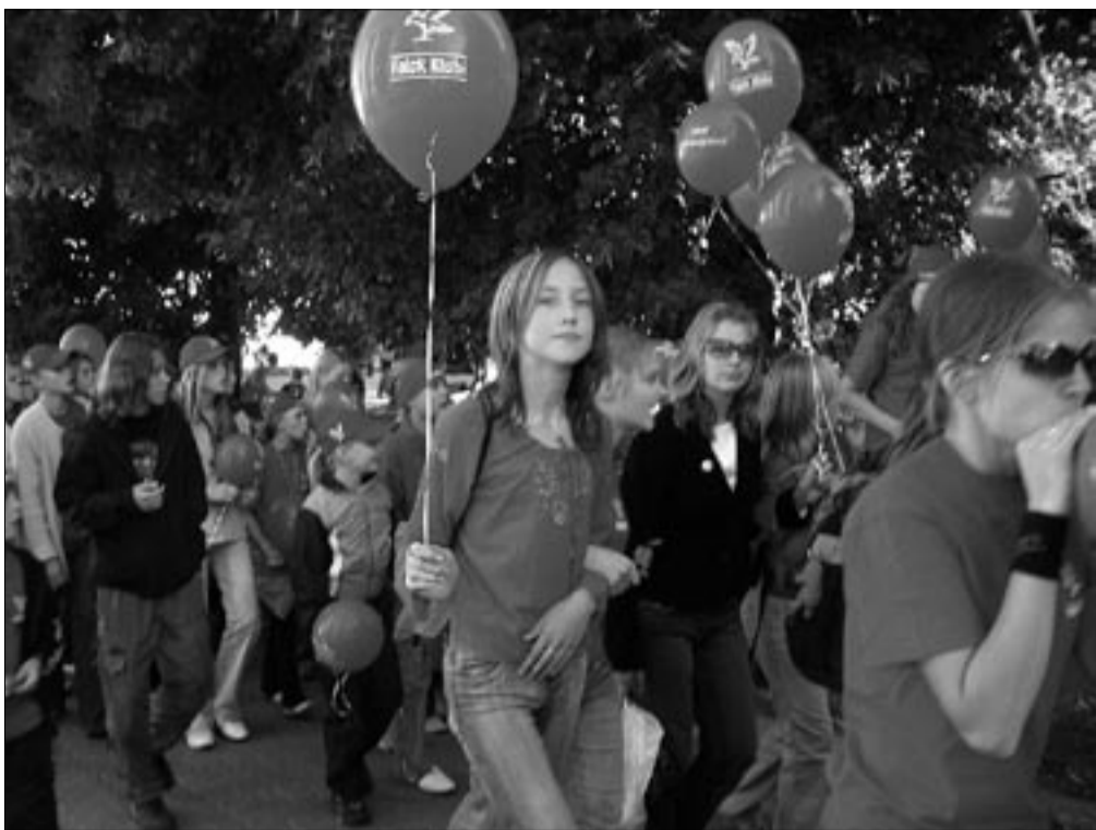
Mõnesajapealine Falck noorteklubi malevarongkäik marssis lippude lehvides läbi Tartu.