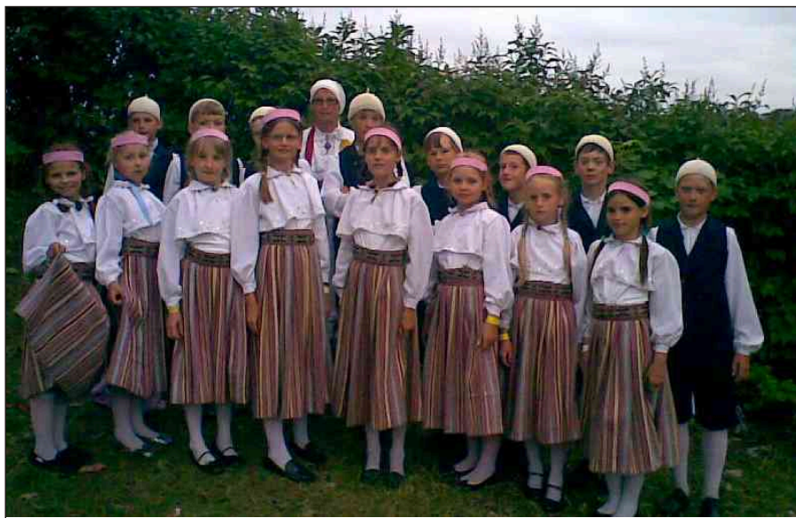
Väikesed laulupeolised on valmis suureks peoks.