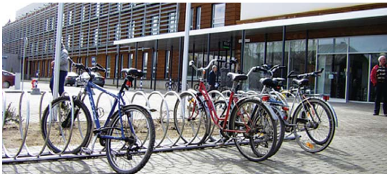
Tartu Maarjamõisa Maarjamõisa haigla külastajatele on nüüd rajatud ilusad rattahoidlad kohe haigla peakuuse juurde, mida juba aprillis aktiivselt kasutati. Pildilt on näha, et osad ratturid eelistavad siiski ka vanu häid poste.