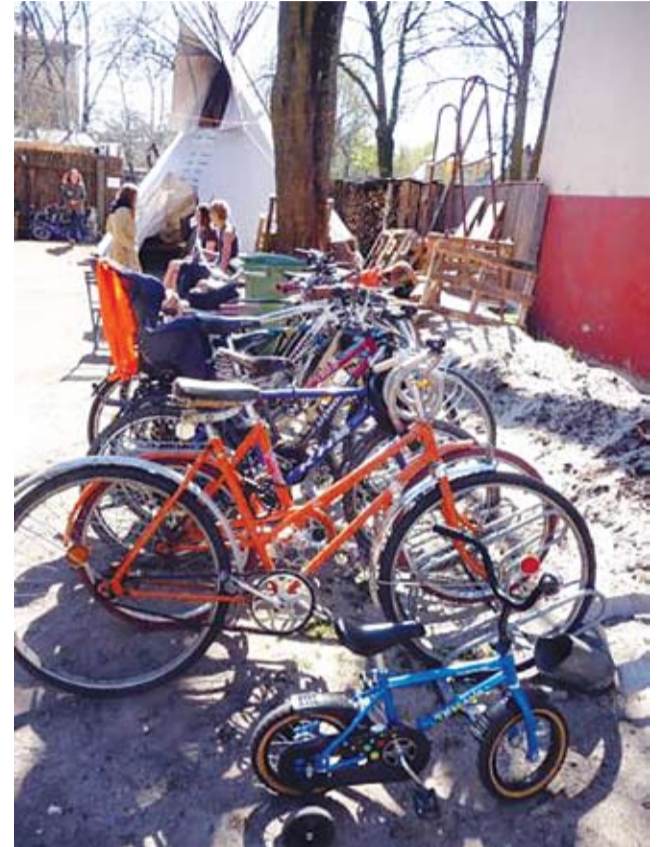
Tallinn, Uus Maailm, Koidu tänav Uue Maailma seltsimaja ümber on alati palju jalgrattaid. Ja veel ka korralikult pargitud. Velokuur töötab ka.

Kuuldavasti on mitmed Tallinna vanalinna asutused saanud innustust sellest linnaruumi väärtustavast lahendusest ja soovivad ka oma külastajate ja töötajate ratas parkimist sarnaselt lahendada