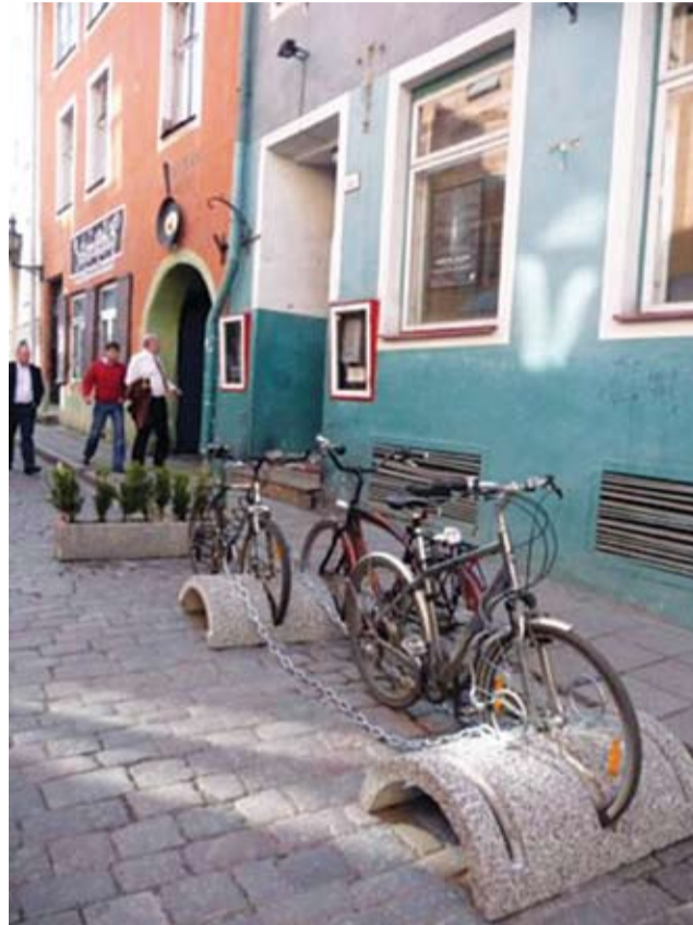
Tallinn, vanalinn, Rataskaevu tn. Von Krahli teater on arvatavasti esimesena Eestis teinud oma rattaparkla tihedalt autosid täis pargitud tänaval auto parkimiskoha asemele.

Tehnikaülikooli teedeinsenerid ennustavad, et 30 aasta pärast on Tallinna kesklinnas kaks korda rohkem autosid ja keskmised kiirused praegusest poole väiksemad, linna äärtes laiuvad tohutud ristmikud, nelja ilma kaare järgi nimetatud väilad ja tunnelid. Sama hästi võin ma ennustada, et Tallinnas on 30 aasta pärast kaks korda vähem autoliiklust, et kõik julgevad hommikul kodust jalgrattaga väljuda ja ka oma lapsi jalgrattal teele saata. Inimesed saavad oma igapäevased asjad