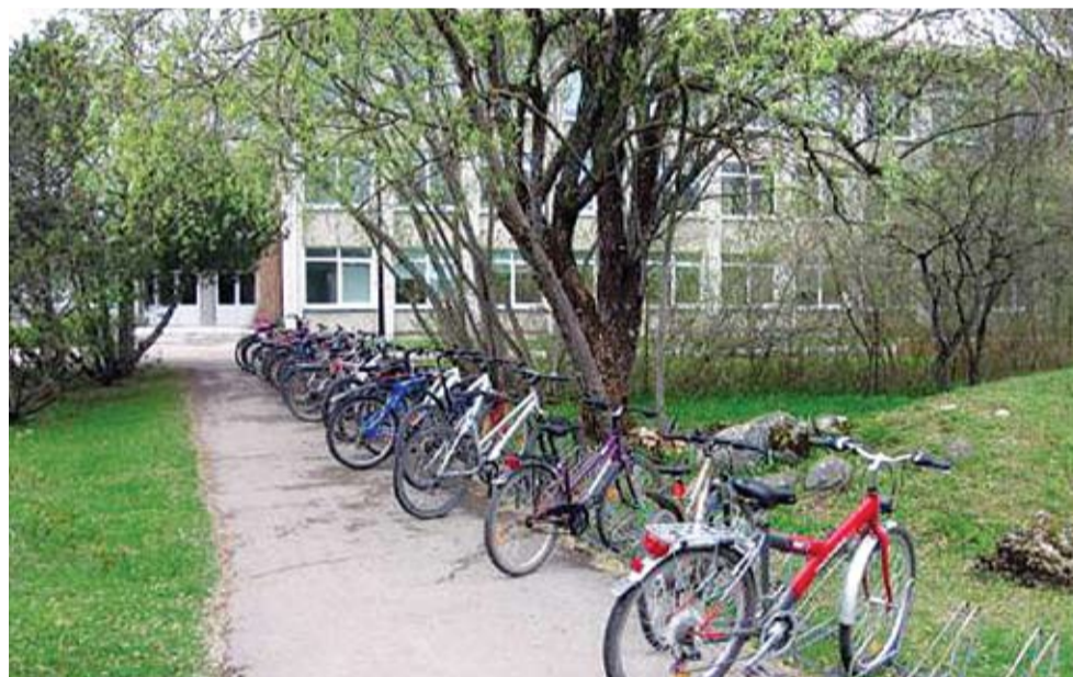
Märjamaa Tegelikult on ümber koolimaja on vähemalt viis suurema või vähema mahutavusega parklat, pilt on tehtud kõige rattarohkemast. Kahjuks oli koolipäev küll juba lõppemas, nii et ratas te reas on näha ka vabu kohti, aga mingi pildi ikka annab