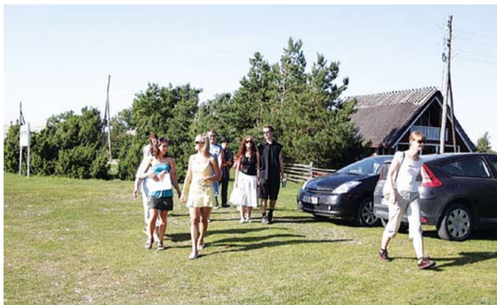
7.-9. august 2009 toimusid Vormsi saarel Noorte Roheliste suvepäevad. Kolme päeva jooksul toimusid igapäevaste keskkonnaprobleemide ja neile parimate lahenduste leidmise üle. Räägiti ka KOV valimiste teemadel. Muidugi oli hästi palju ka erinevaid lauamänge ning lisaks mängiti korvpalli, jalgpalli, võrkpalli, käidi ujumas Toimusid ka põnevad ekskursioonid saare vaatamisväärsustele.

vinud müüdid: mitmed noored võib-olla arvavad, et kõik Noorte Roheliste liikmed on padurohelised, elavad muldõnнис ega jaga muust maailmast tuhkagi. Nende rahustamiseks võib käsi südamele väita, et see ei ole kohe kindlasti nii. Üldsegi mittegi!