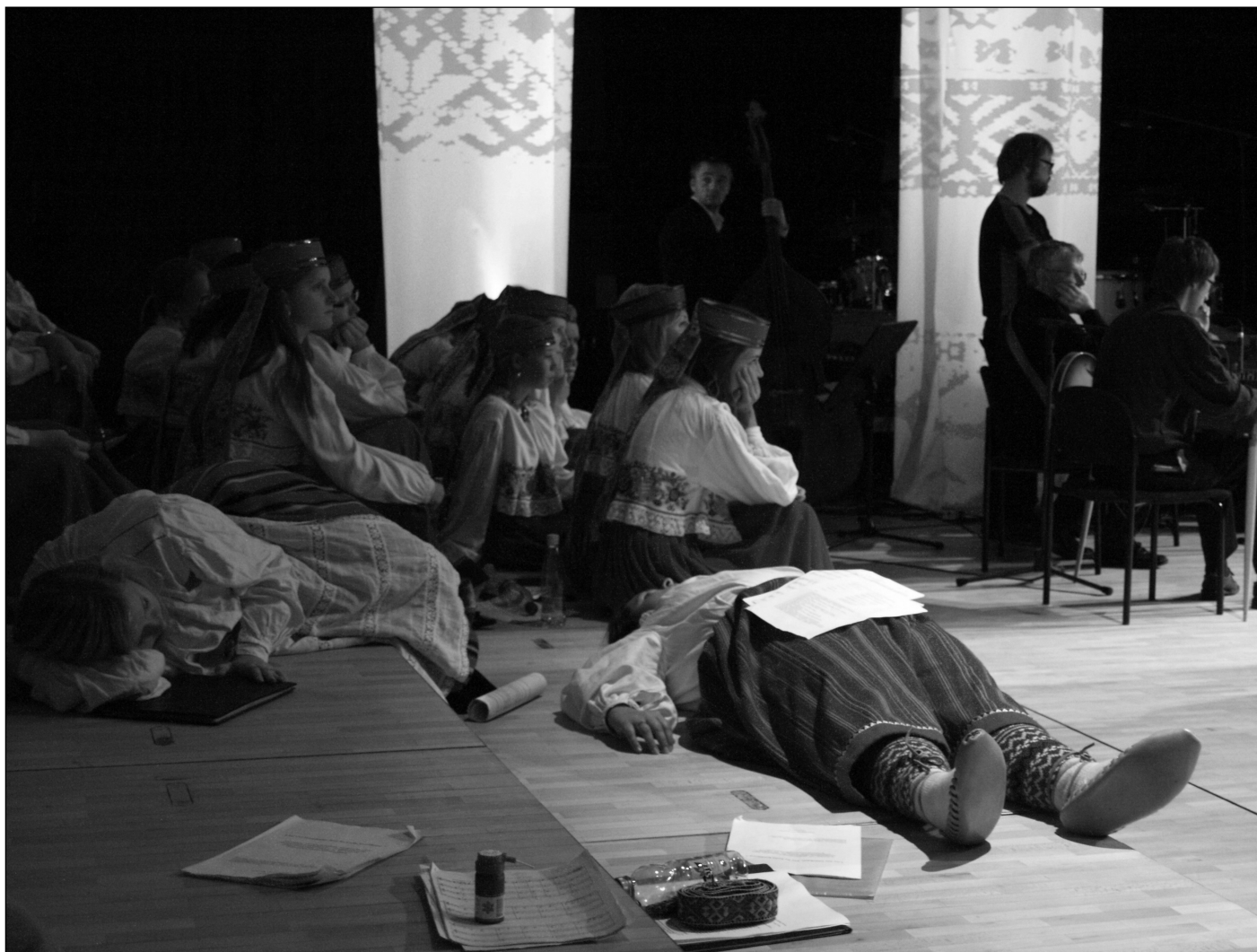
Natüürmort Vanemuise kontserdisaali ja kurgurohuga. Kunst on Kammerkoorist oma esimesed ohvrid leidnud.