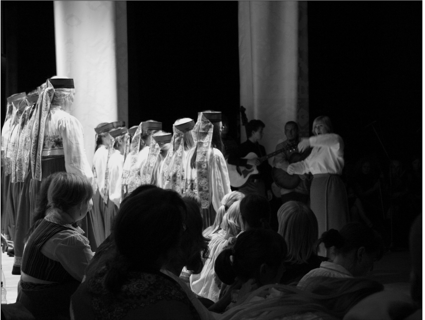
Aasta tähtsündmus TÜ 375 juubeli kulminatsioon Gustavi Gala läbi koorilaulja silmade.

Tartu Ülikooli Akadeemilise Naiskoori häälekandja