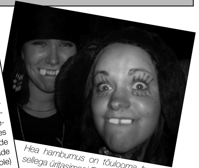
Hea hambumus on tõulooma tunnus, sellega üritasimegi Tallinna mehi võluda.

Üritused olid ikka nende nägu ja tegu, kes neid korraldasid ja neist osa võtsid. Kronoloogilisest taustsüsteemist juhindudes peaks alustama suusalaagrist. Uhh, Tallinn, mu Tallinn, sa Eesti Muusika Karika võitnud koori linn! Mh, mehed kui metsapullid! Näha oli nii vanemaid-kavalamaid kui nooremaid ja jõulisemaid isendeid. Mõned ürgtarvad olid ka kohal. Ürituse läbivaks teemaks oli seekord metsarahvas ja nende tegemised – urr! Metsaelukad said seada oma saba ja sarvi karao-kes, limbotantsus, iidse lumesõjakunsti, naiselike ja mehe- like tootemisammaste püstitamises, ninaesise muretsemises ja selle töötlemises, vastastikusel seljapesemises (see täide otsimine on primaatidel ülioluline sotsiaalse hierarhia ja heade suhete hoidmise vorm, tehakse ka siis, kui täisid seljas pole) ja suusatamises-uisutamises ikka ka. Ilm oli pehme, suusk lippas kui jännes ja võitsid sport ja sõprus, nagu koorirahval kombeks.