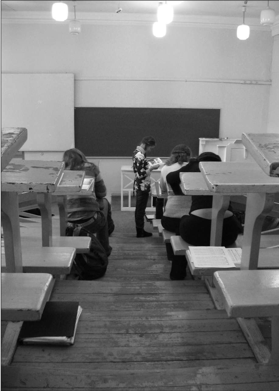
Auditoorium 232 enne remonti.