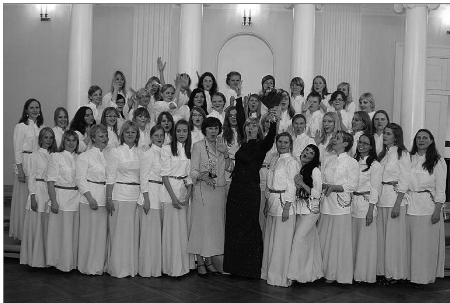
Olgu eestlased tervikuna laulurahvas või mitte - tänu Triinile oleme meie vähe-malt sinna poole teel!

Lahenduseks on sõna, millega võib tähistada igasugust Naiskooris valitsevat ajutegevuse ( nt. mõtlemise) häiret ning üldist valitsevat ärevat/depressiivset/tülpinud konditsiooni. Eriti eksponeeritud ollakse sellisele seisundile Leedus.