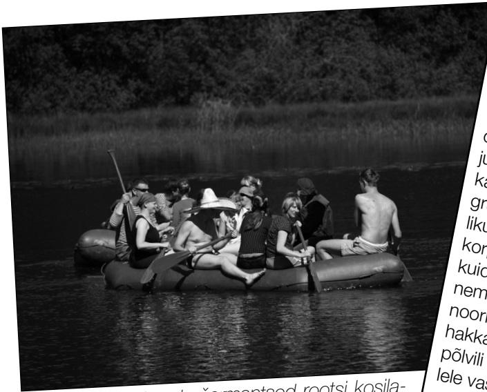
Kas need ongi meie šarmantsed rootsi kosilased? Ei siiski ainult meie oma Tartu mehed...