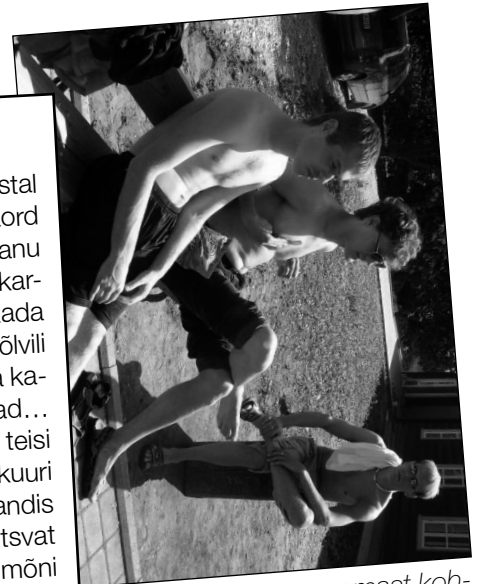
Ülesvõtte ühest varasemast kohtingust, kui muru veel rohelisem ja taevast sinisem oli...