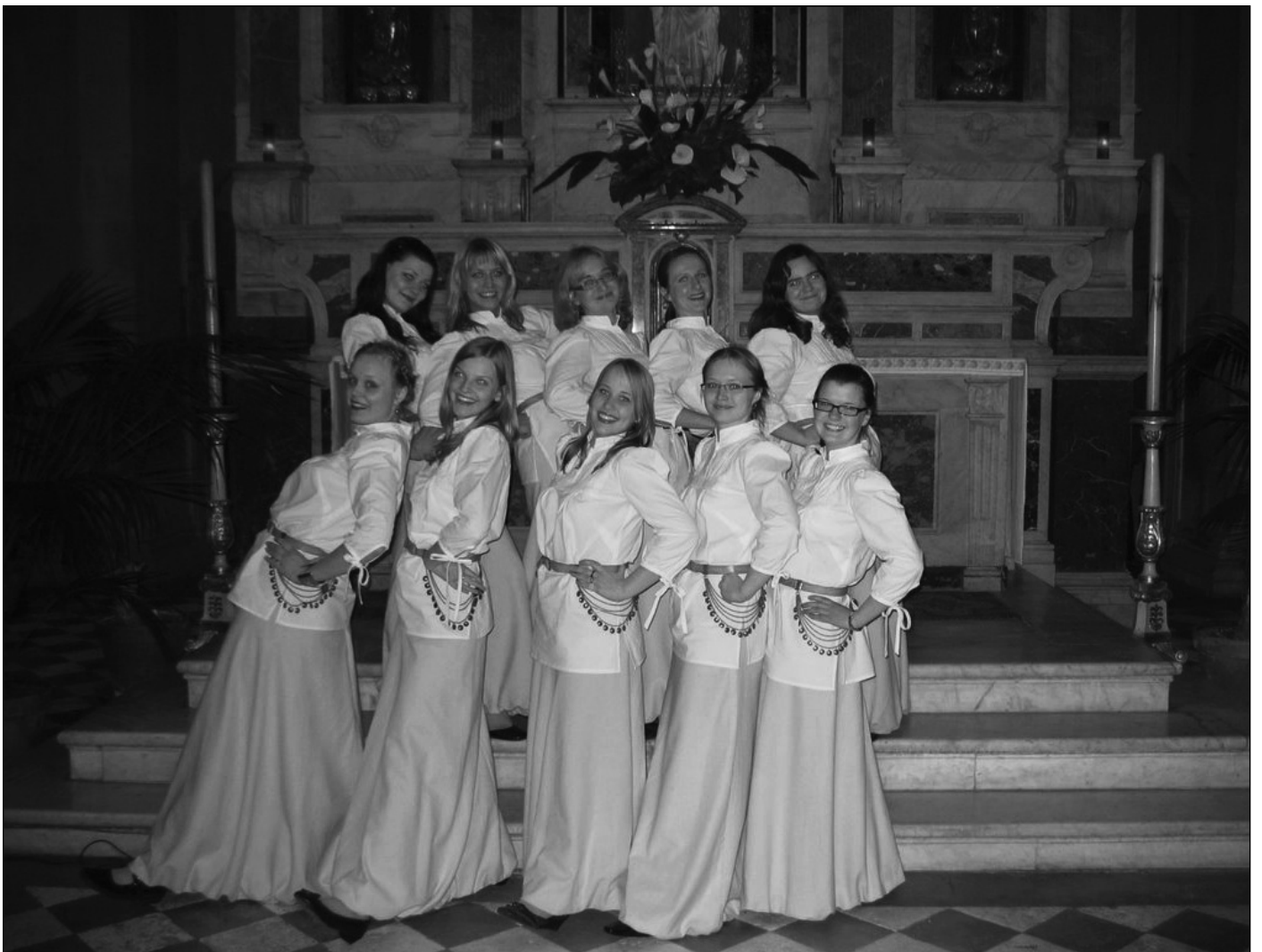
I sopran oma kevadises hiilguses Itaalias.