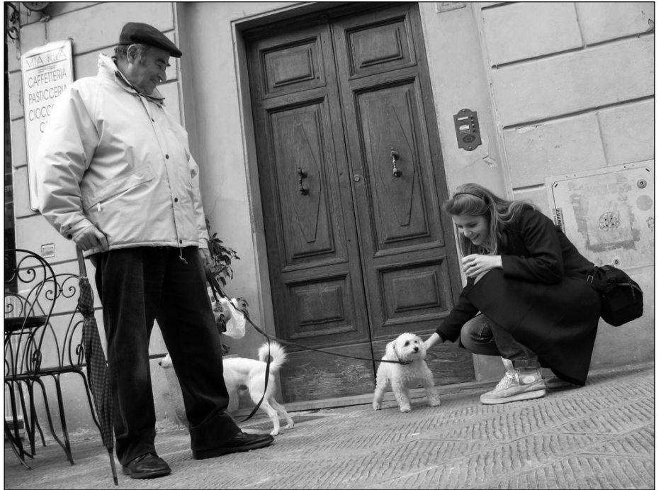
Just nii on võimalik sulatada kange Eesti naise süda.

Minu Itaalia tipp hetkeks jäi aga frantsiskaani kiriku rajaja püha Franciscuse ja klarisside pühaku Chiara kodulinna ning UNESCO kaitseasula Assisi külastamine Perugia maakonnas. Ehe itaalia maa-