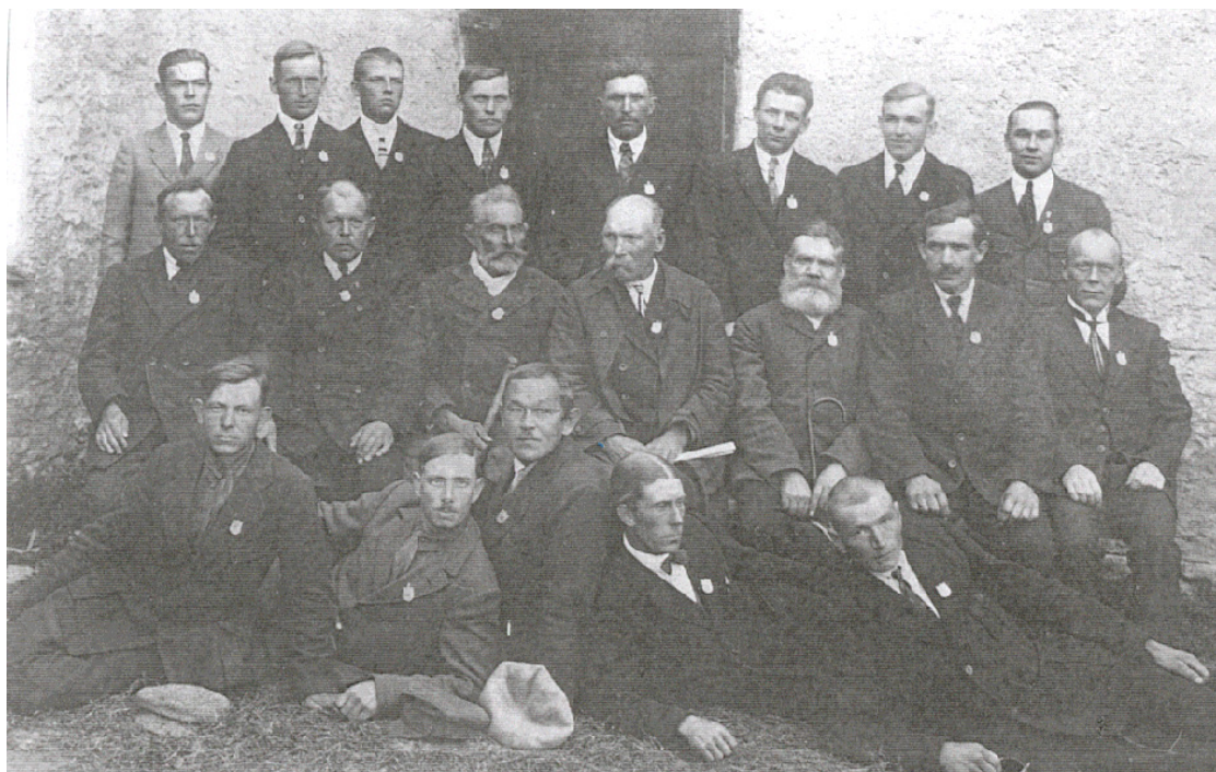
Kiiu valla rahvalugejad 1922