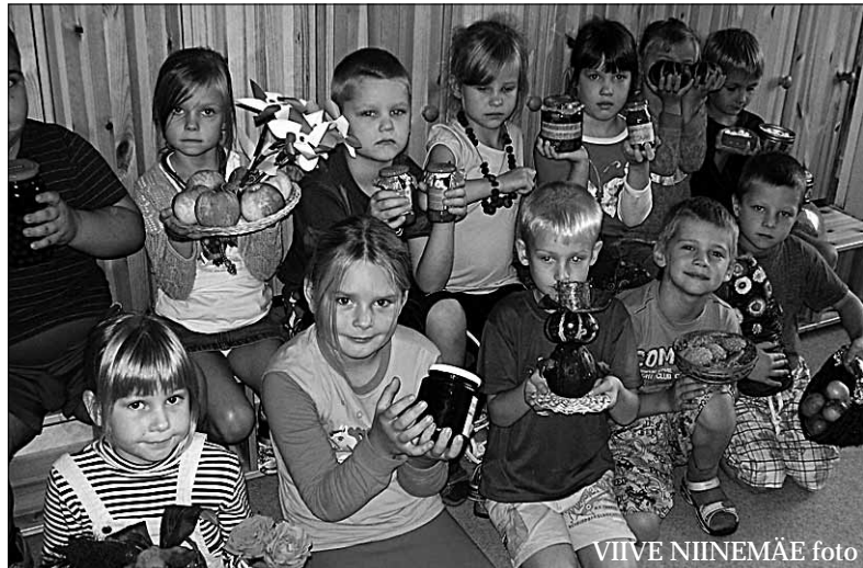
● Miiklipäeva tähistati rõõmsalt ka Abja lasteaias III rühmas.