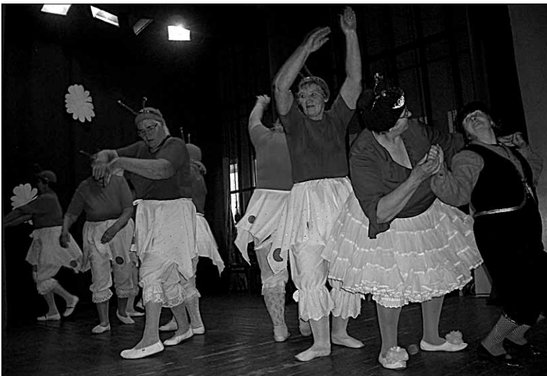
● Halliste rahvamaja krapsakate memmede tantsurühm Mamma Miia pani publiku pulsi kiiremini põksuma ja teenis tulise aplausi nii eakate päeva tähistamisel Kaarli rahvamajas (pildil) kui maanaistepäeva peol Uue-Karistes.