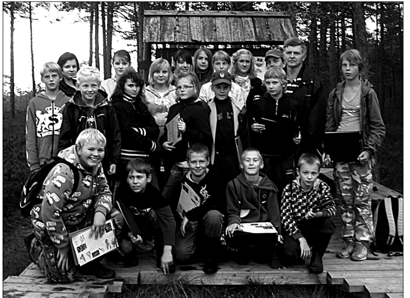
● Mõisaküla kooli vanemate klasside õpilased veetsid tervistava ja loodustarkusi lisanud päeva sügismatkal Soomaal.