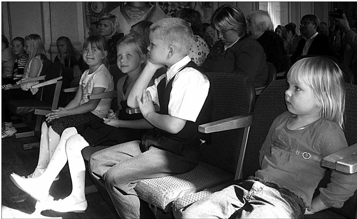
● Seda, et Abjat on kirjastõnas mainitud juba 505 aastat tagasi, kuulsid ettekandepäeval kultuurimajas ka seda lauluga ilmestanud noorima põlve abjalased.