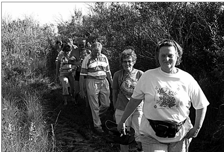
● Röömsad matkasellid Mulgimaalt Osmussaare radadel.