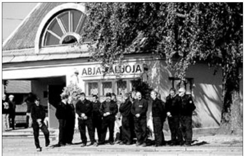
● Abja-Paluoja päästedeepoo uue torni ja tornikiivriga juurdeehitise avamine oli pidupäevaks eriti kohalikele päästetöötajatele (pildil), tänu kelle tublile tööle puhkuse ja vaba aja arvelt ehitus valmis.