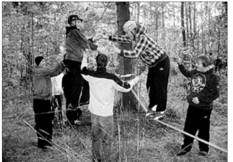
• Tervispäevaga ühendatud noorte elamuspäeval Mõisakülas pakkusid kohalikele noortele erinevate kõieradade läbimisel metsas konkurentsi eakaaslased Karksi-Nuiast.