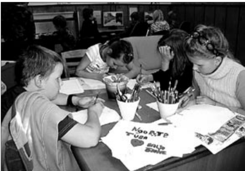
● Abja noortetoa sünnipäeva puhul joonistasid poisid-tüdrukud seal ka toredaid päevakohaseid õnnitluskaarte.