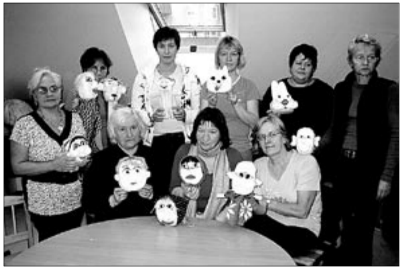
• Lasteaednikest käpiknukkude valmistajad oma loominguga.