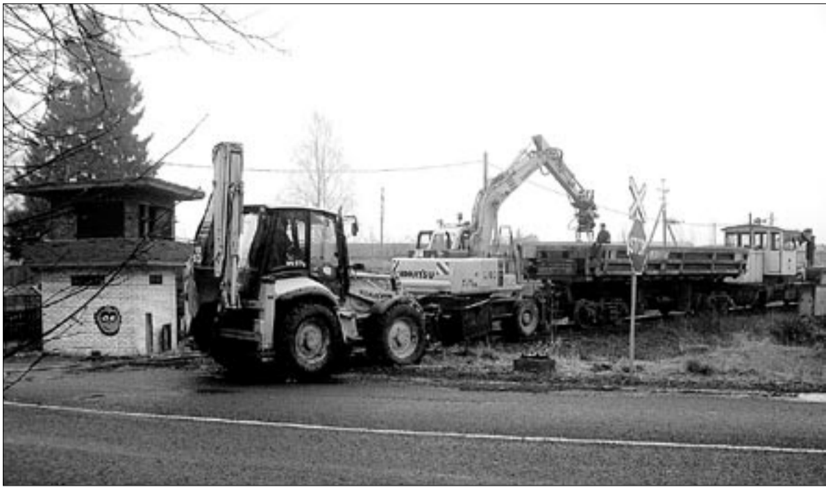
● Mõisaküla lähiajaloo üks märkimisväärseid tähtsaid on 23. jaanuar 2008, mil algas raudtee ülesvõtmine lõigul Mõisaküla-Pärnu.