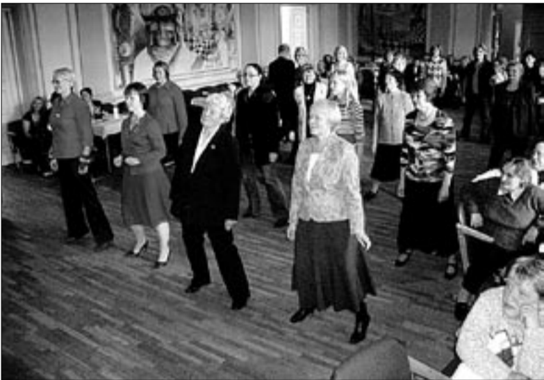
● Traditsioone hoidvad maanaised tahavad ka ajaga kaasas käia. Kokusaamisel Abjas olid nad varmselt nõus tänapäevast line-tantsu õppima.