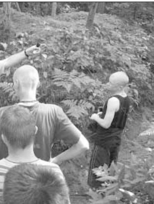
Mart Laar koos noortega matkarajal