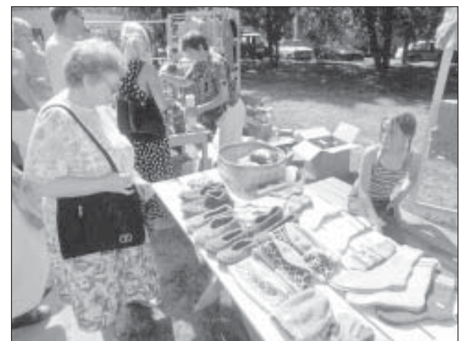
Väinamere projekti poolt algatatud suve- ja jõululaadad on muutunud oodatud sündmuseks käsitöövõlviliste seas.

Mida laata pakub? Eks igal aastal midagi uut ja üllatavat, kuigi omaette väärtus on asjal, millele hing sisse kootud, punutud... Ega käsitöömeistri jaoks polegi nii kerge kliendi soovidele vastu tulla. Lihtsam on teha seda, mida koguaeg on tehtud. Kahjuks on meie ostjaskond aasta-aastalt ikka üks ja sama, pole tegu turismihooajaga, kus mõni turismibuss ootamatult laadale võib eksida. Mis tähendab, et see vana hea kogu aeg tehtud asi ei pruugi müügiks minna.