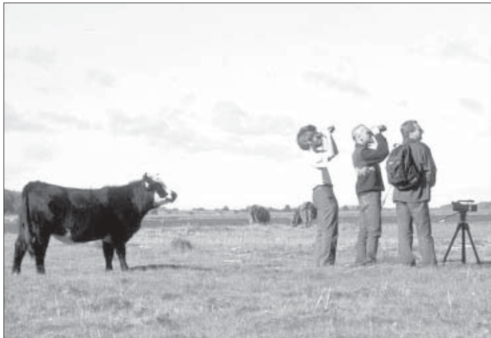
Ringlus looduses: veiste poolt puhastatud rannaniidud meelitavad ligi linde, need omakorda turiste, need omakorda veiseid...

Kvaliteetsed ei pea olema mitte ainult üksikud turismitegevõtted (majutuskohad, söögikohad) vaid praegu peaks arendama just kvaliteetsed turismitooted tervikuna, pakettidena. Esimesed sammud on tehtud Väinamere projekti toel spetsiaalsete pakettide väljatöötamisel, meil on pakku- da linnuvaatlus-, orhidee- ja jalgrattapakettid. Paketi puhul peab kvaliteetne olema kõik, alates reisikorraldusest, majutuskohast, söögist kuni iga konkreetse probleemi lahendamiseni välja. Nii võib turismi-ettevõtjal kasu olla kvaliteetse veiseliha tootmisest ja omanäolise käsitöö edenemisest. Rahule peab jääma iga nõudlikum