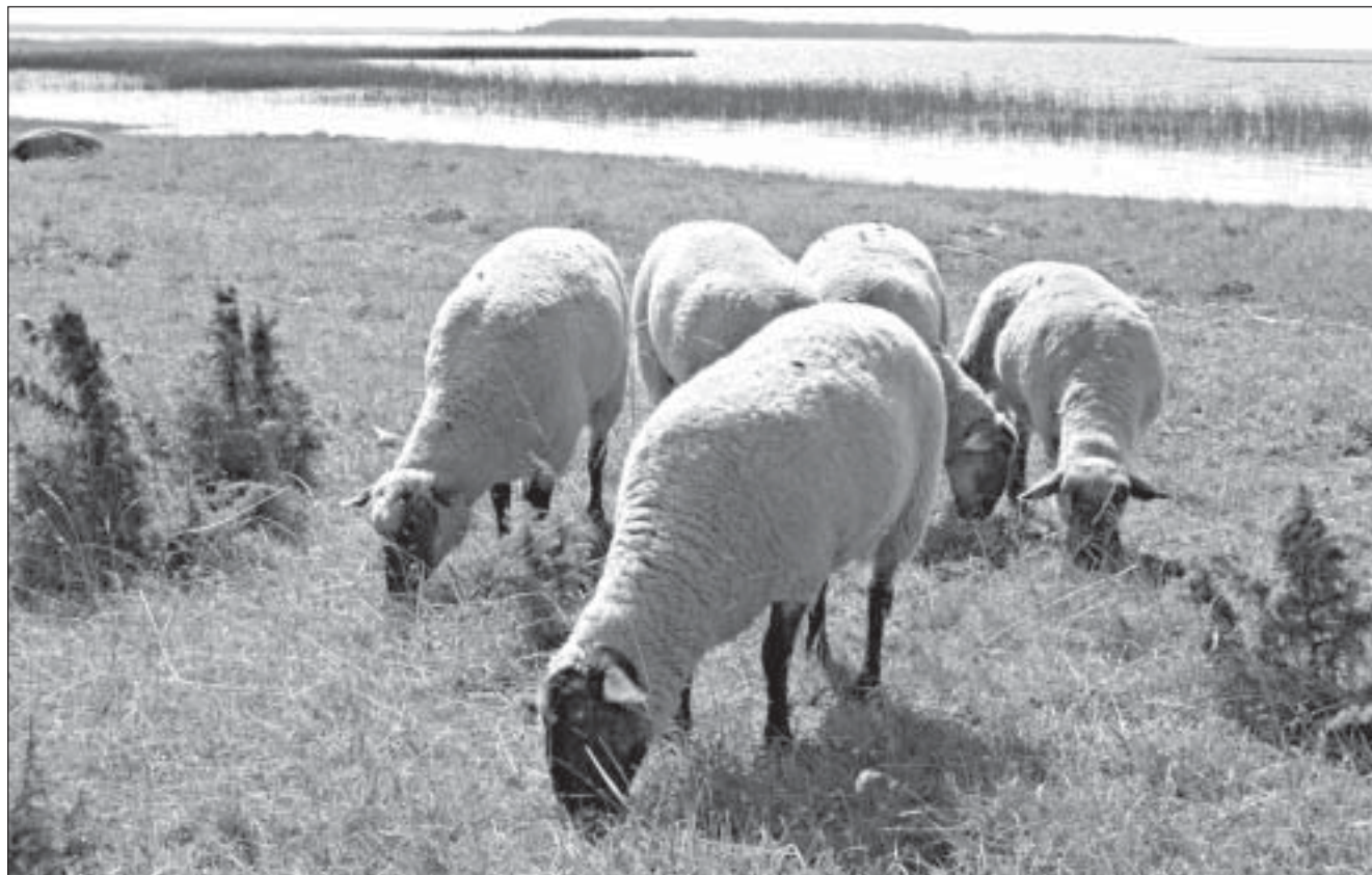
Lambakasvatuse vastu on vormsilaste huvi pidevalt tõusnud. Väikesaare tingimustes on lambaid majandada lihtsam kui lihavesiseid.

Teine suur probleemide ring on tegelik saare maaomand. Saare külalised ei jää märkamata sajad hektarid söötis põlde ja niitmata heinamaad. Kohalikke maaomanikke talupidamise mõistes on vähe. Maad on sageli jagatud kitsasteks siiludeks. Kui kohalik talunik