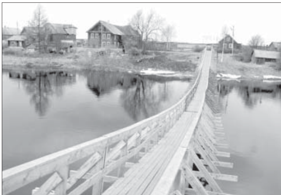
Väinamere projekti kogemus laieneb Karjalasse, kus Olonka jõe kallastel on vanad külad ja rändeajal sajad tuhanded haned.

Sidemed kogu Eesti turismimajandusega on eriti olulised turunduse seisukohast. Kui me võrdleme kogu Eesti turismi pärlikeega, kus iga pärl kujutab omaette teguselt, siis võiks Hiiumaa sealt välja paista kui üks hästi värvikas pärl, kuid eemalt vaadatuna on siiski oluline kogu kee silmapaistus. Me peame jääma iseendiks, aga seda ikka koos teistega.