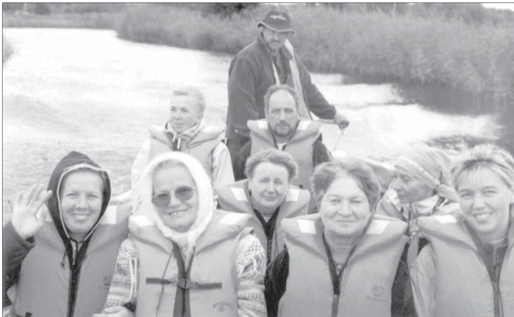
Karjala turismi-inimeste õppereisi ajal augustis 2003 prooviti mitmeid loodusturismi vorme, ka paadisõitu Matsalu roostikus.

Veisekasvatus. Ei ole suutnud arvet pida, kui palju on täpselt Väinamere projekti loomadel järglasi aga selgus, et võrreldes 1996. aastaga on veiste ja lammaste arv peaaegu kahekordistunud, kuid hobuseid on veidi vähemaks jäänud. Väinamere projekti mägiveised ja herefordid on