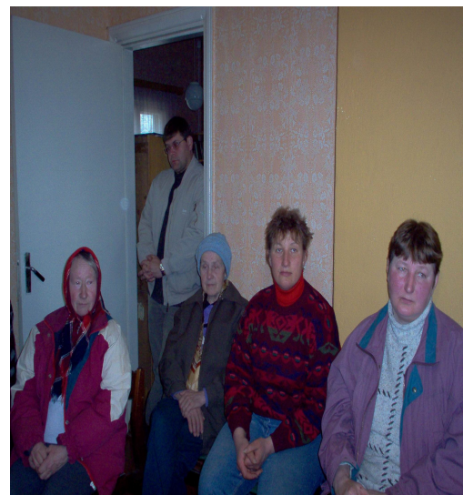
Volikogu liikmed Reinevere külas rahvaga kohtumas

Küla siseseks mureks on vast see kõige suurem, et pole veel ühist kii- ke ega külaplatsi. Vald oli nõus uurima võimalusi endise lagune- nud koolimaja, mis riivab silma kol- ledal kombel, likvideerimiseks. Selle asemele seame oma vaimusilmas kena küla- ja kiigeplatsi, laste liiva- kasti, istumispinkidega, kuhu on ka kõik Reinevere sõbrad ja valla- elanikud oodatud tulevikus üritus