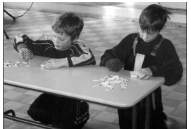
Sel aastal kütis algklasside õpilaste kirgi lõbus showmäng "Minu vägitegu".