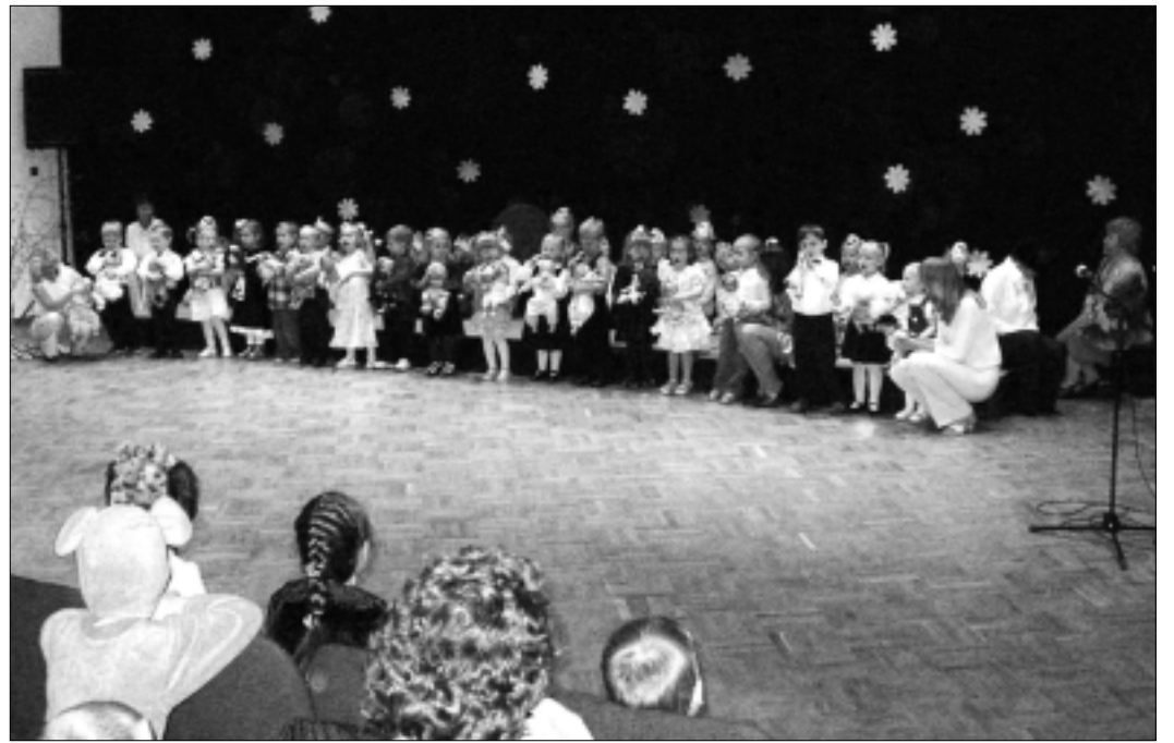
Lasteaialaste emadepäeva kontsert kultuurikojas oli südamlük kingitus emadele-vanaemadele ja tegi rõõmu esinejatele.