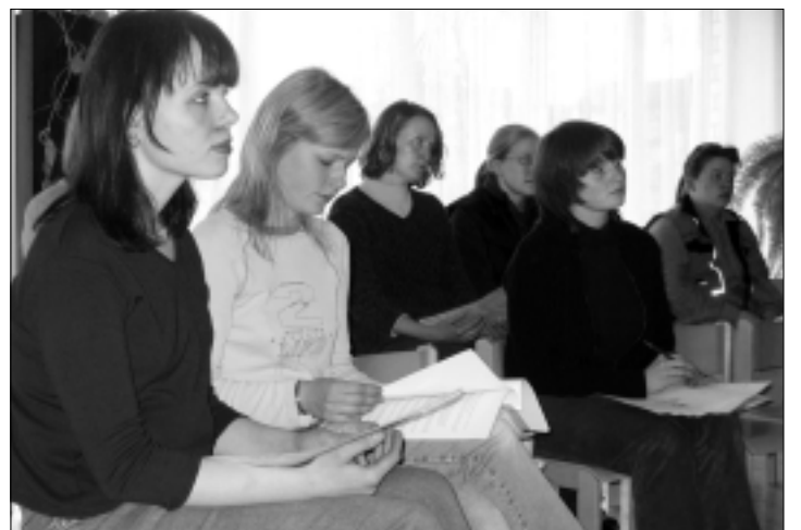
Pisipõnnide emad olid tulnud peale päevatööd lasteaiada kuulama vajalikku loengut laste väärkohtlemisest.