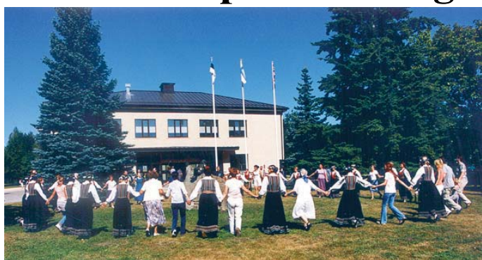
Jõgevahe pere tantsijaid on nimetatud õigustatult linna lipulaevaks. Tuult teile purjedesse ja uusi kohtumisi nii linna erinevates paikades kui Euroopas.

Edasi sõitsime Antwerpeni Europeade'le. Kui Lõuna-Bel-