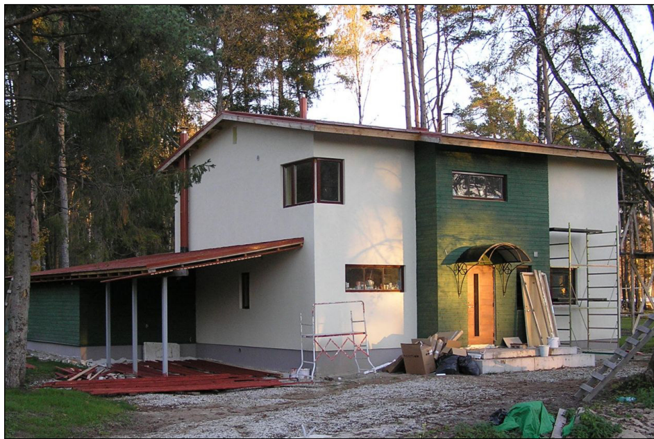
Timo Luhari elamu Puraviku 3