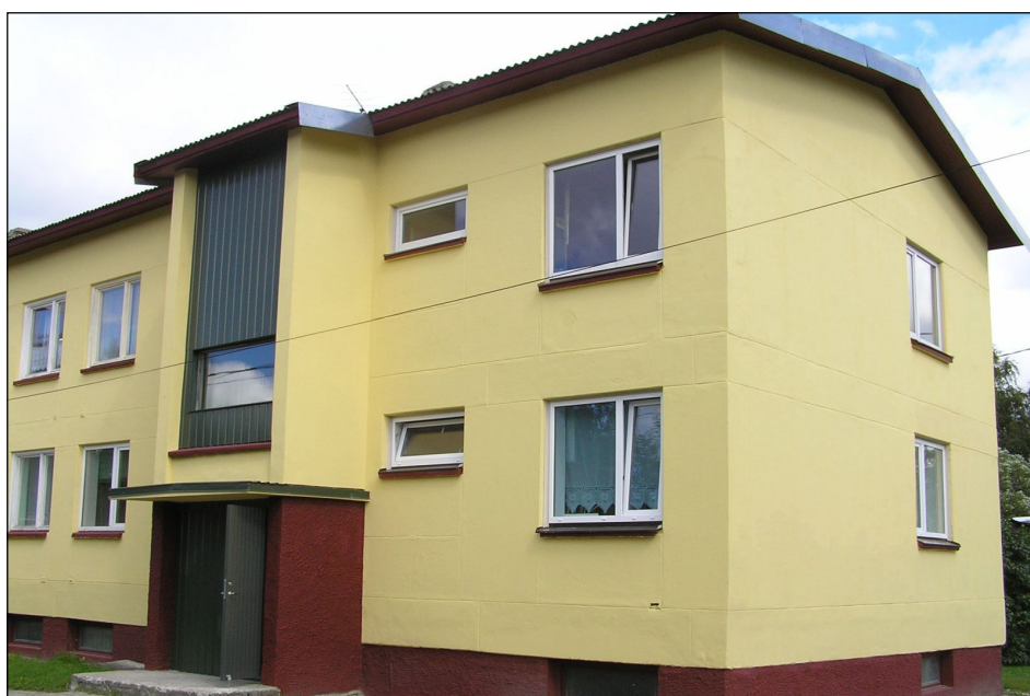
Korteriühistu Priidu Kodu 12-korteriga elamu Pärnade pst 8