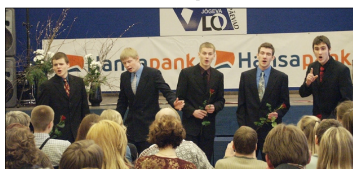
Jõgeva Gümnaasiumi noormeeste ansambel üles astumas Alo Mattiiseni muusikapäevadel.