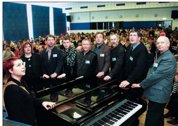
Tänavuste Alo Mattiiseni muusikapäevade zürri ehk Suur Kõrv.