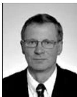
173 SILVER ELJAND Tehvandi spordirajatiste meister Otepää kõigepealt otepäälastele!