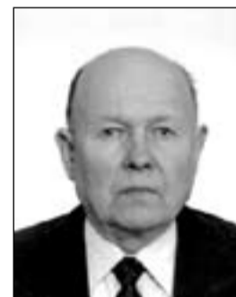
174 UNO KIKKAS pensionär Otepää turvaliseks vallaks!