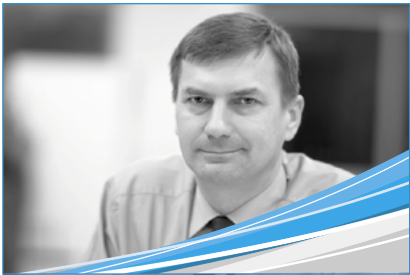
ANDRUS ANSIP, Reformierakonna esimees

Mistahes paiga teevad eriliseks seal elavad inimesed. Olen sageli külastanud Otepääd ja võtnud osa mitmetest rahvusvahelistest üritustest. Kellelegi ei tohiks jääda märkamata paljud head muutused, mis on teinud teie valla eriliseks kogu Eesti silmis. Olete ju Eestimaa talvepealinn, tuntud spordikeskus ja arvukate suurvõistluste toimumiskoht ning meelispaik paljudele turistidele.