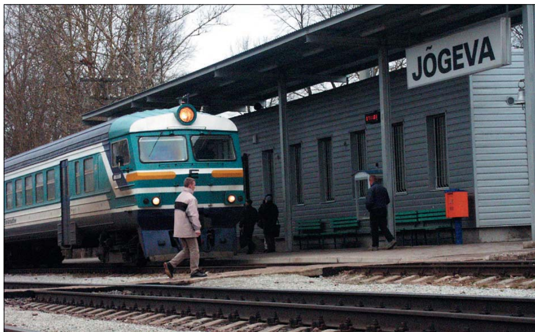
Täna ei ole veel selge, kas tulevikus saab teisele poole raudteed tunneli või silla kaudu.

Linna üheks mureks on raudtee-äärse alaga seon-