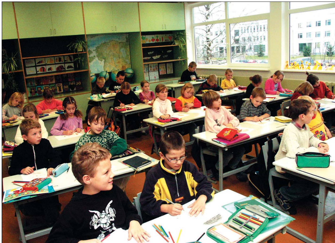
Jõgeva Linnavolikogus kinnitati muu hulgas ka haridus- ja kultuuri arengukavad aastateks 2004-2006.