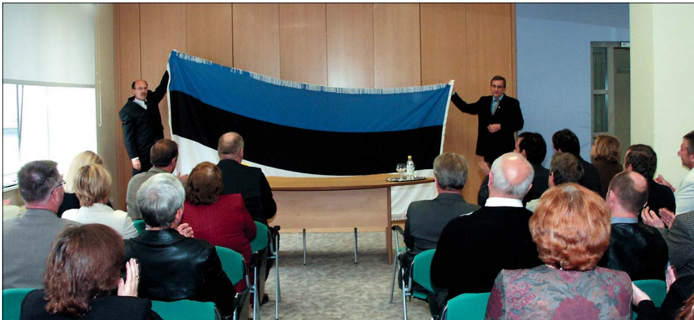
Hetk peaministri visiidist Jõgevale 14. oktoobril.