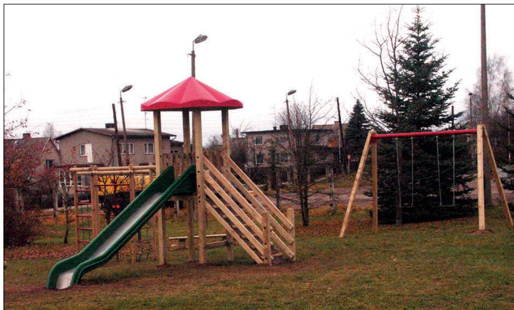
Turu tänaval asub uus mänguväljak.

Eelmisel aastal paigaldasime linna rularambi. Seda on korraliku skateparki jaoks muidugi vähe, kuid juba järgmisel kevadel soovime täiendada väljakut uute atraktsioonidega.