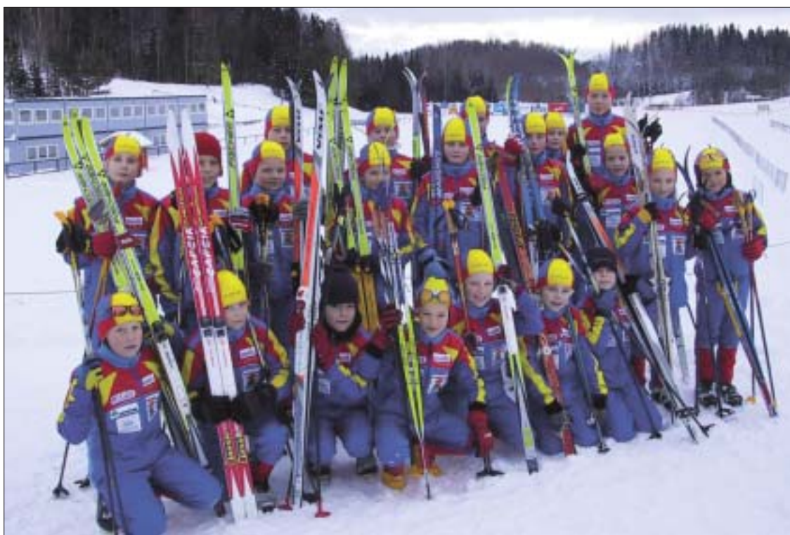
Karupesa Team'i lapsed

Need tulemused on esiletõstmist väärt, sest ETV-Visu-Kalevi sarja näol on sisuliselt tegemist nende vanuseklasside Eesti meistrivõistlustega. Näiteks hooaja lõppvõistlusel Haanjas oli vanuseklassis M11 stardis