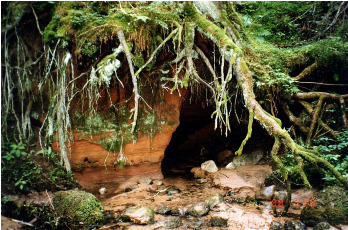
Samblad eelistavad varjukaid ja niiskeid paljandeid (paljand Ahja jõe ääres).

Koos varasemate uuringutega on liivakivipaljanditel praeguseks registreeritud 47 sambaliiki. See nimestik ei ole kindlasti täielik ja ootab huvilist põhjalikumalt uurima liivakivide sammalde vegetatsiooni.