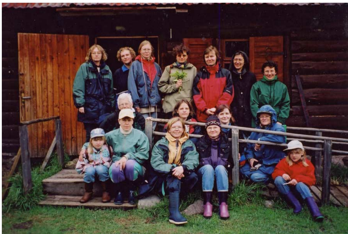
Foto kokkutulekust osavõtjatest enne ärasõitu.