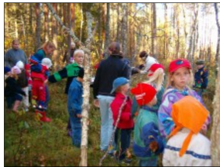
Rabamatk, millest võtsid osa kõik lasteaialapsed, õpilased ja töötajad