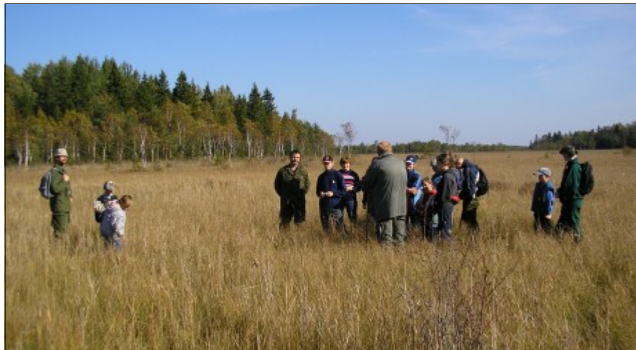
Õõtsik Mahtra rabas