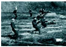
Treeningu juurde kuulus võistlus "duell".