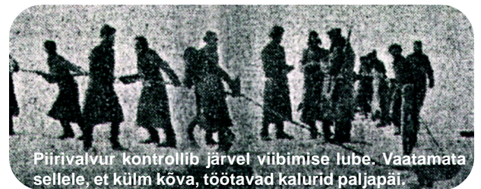
Piirivalvur kontrollib järvel viibimise lube. Vaatamata sellele, et külm kõva, töötavad kalurid paljapäi.