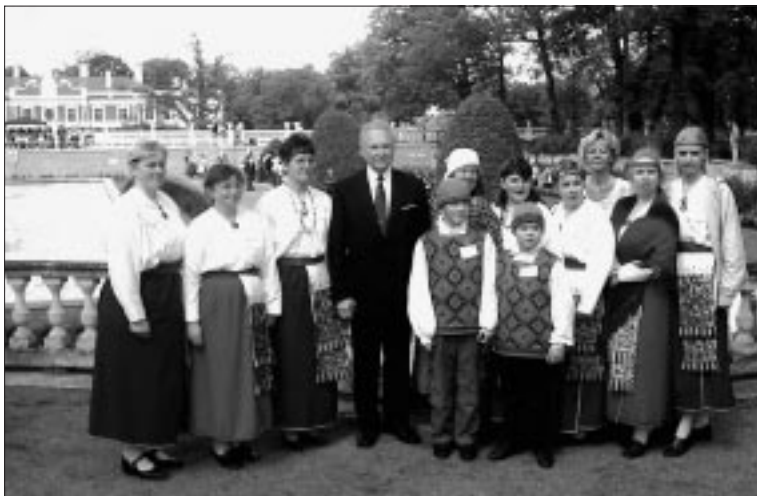
• Folkloorirühm “Krõõt” presidendi vastuvõtul.

Kõige enne oli pikem peatus Pühajärvel. Sanatooriumi ümbruse puhkealad olid meeldivalt korras-