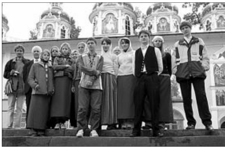
● Petseri osutus põnevaks linnaks.

Iga koht on eriline. Kirikute puhul on eriline veel arhitektuur – nii seest kui väljast, ja eriti kõla! Ainuomane helikeskkond pääseb esile vaid siis, kui esineda naturaalselt, ilma elektrilise helivõimendusega. Muusika peegeldub tagasi seintelt