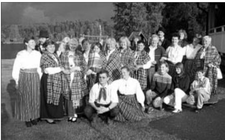
● Karksilastest esinejad Lilltorpetis.

Õõbisime kauni järve äärses Vikagardeni turismitalus, kus oli meie kasutusse terve maja ja köögis toidutegemise võimalus. Uudistasime