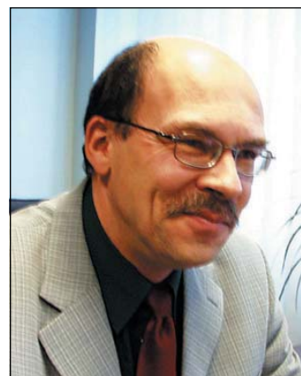
VIKTOR SVJATÕŠEV Jõgeva linnaapea