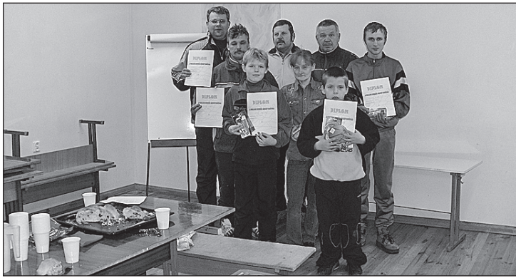
• Tuhalaane Kirikumäe jooksu parimad.