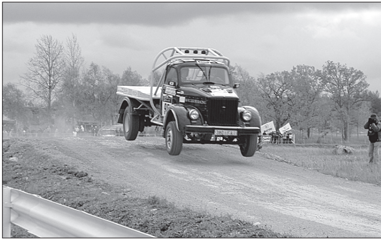
• Fotol on hetk Jaanus Liguri võistlusest 2003. aastal Saaremaal.