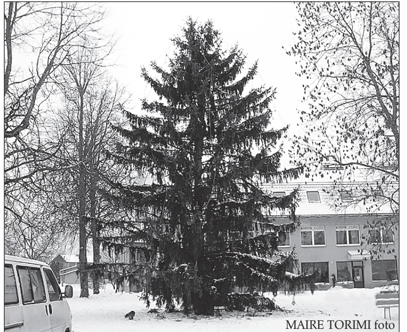
MAIRE TORIMI foto