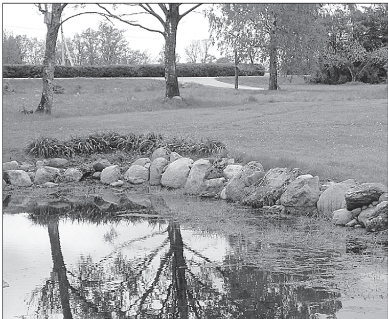
• Jaaksood on rajanud oma talu juurde tiigi.

Olga Palu, üldplaneeringu koostamise kontaktisik, olga.palu@karksi.ee, tel. 435 5517 ja 5341 2507