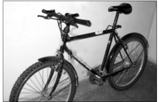
Fotol olev ratas ootab omanikku Tapa politseijaoskonnas.