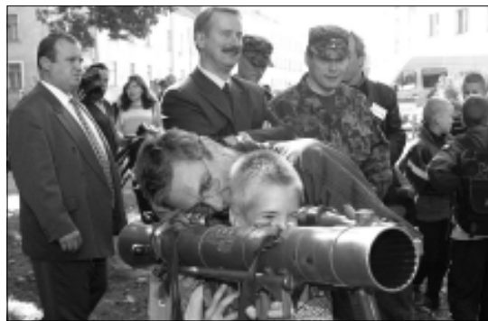
Õppuste avamisel tutvus ka peaminister Siim Kallas kaasasge sõjatehnikaga.

Ajakirjanduses ilmunust tegi kokkuvõtte Heiki Vuntus