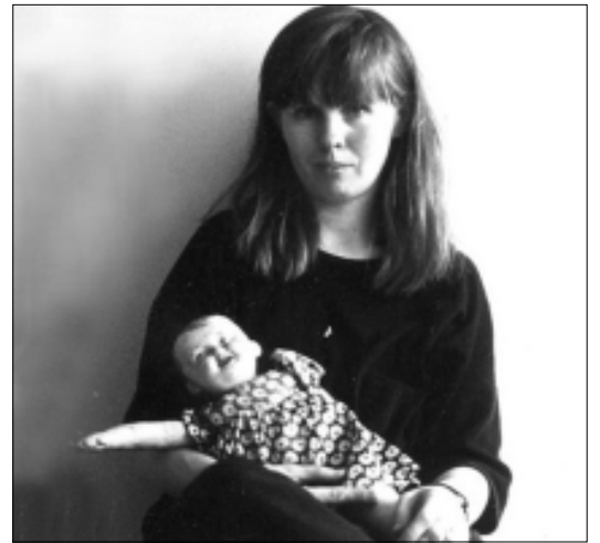
Mare Hunt on kujundanud märguajade muuseumi reklaamsidid ja osalenud aktiivselt näituste ülespanekul.