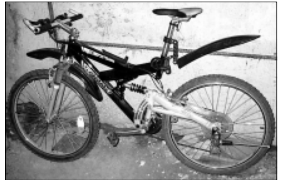
See jalgratas leiti Roheline tn 20 hoovist. Ratta kaotajal helistada telefonil 056 495 436.