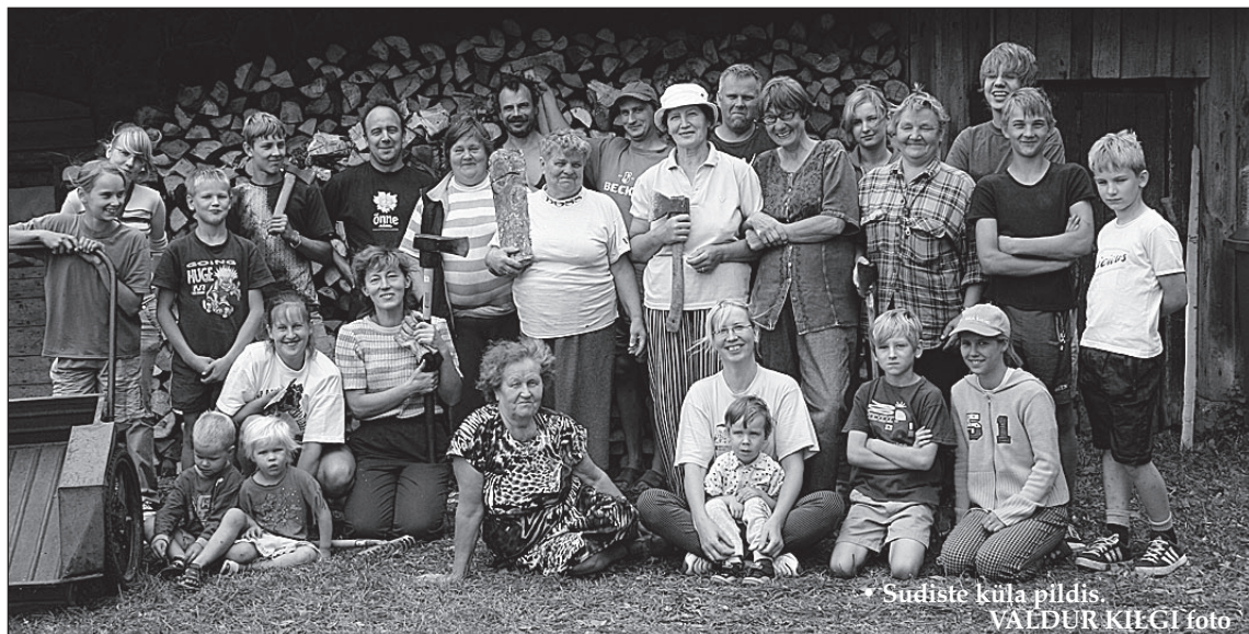
* Sudiste küla pildis.