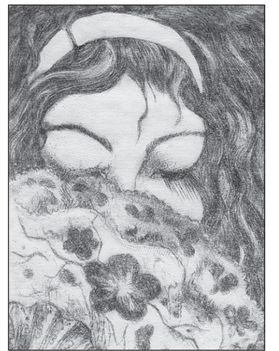
• "Hispaanlanna", Karin Kukkk, kuivnõel, 2005