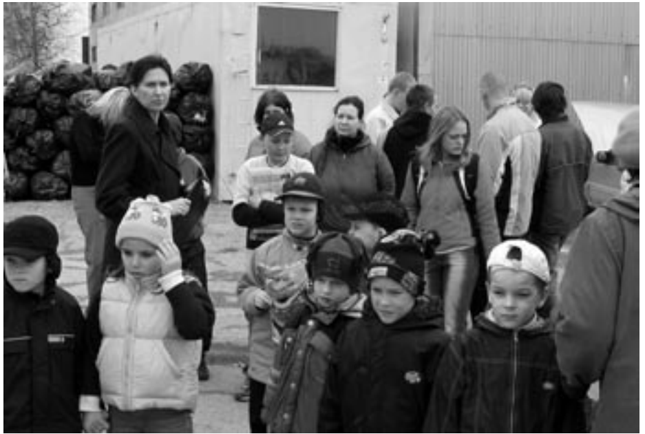
Väikesed ja suured prügimajandusega tutvumas