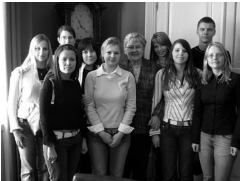
Riigikogu esimees Ene Ergma Puhja Gümnaasiumi külaliste keskel

Hiljem sai abiturientidele võimalikuks võtta osa Riigikogu istungist, mida juhtis tavapäraselt spiiker Ene Ergma. Rahva küsimustele olid vastama tulnud peaminister Andrus Ansip, sotsiaalminister Jaak Aab ning justiitsminister Rein Lang. Küsimused puudutasid Venemaa Eesti okupeerimise tunnistamist, sundüürnike olukorda, pensionäride probleeme, suhkrutrahvi probleemi ning puuetega inimeste elu parandamist. Meie õpilased küsisid peaminist-