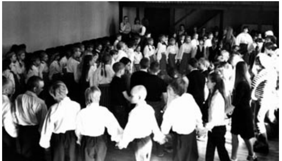
Tartumaa laste folkloorirühmad tantsuhoos

Järgmine kokkusaamine sama selts-konnaga on juba juubelihõnguline.