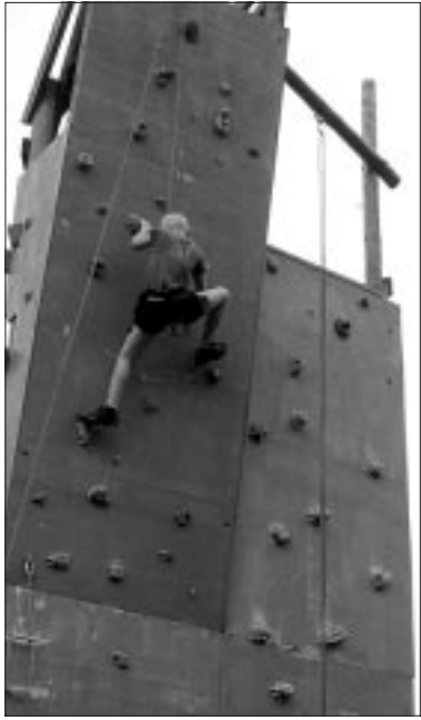
● Kõige suuremat huvi pakkus laagrilistele ronimissein.