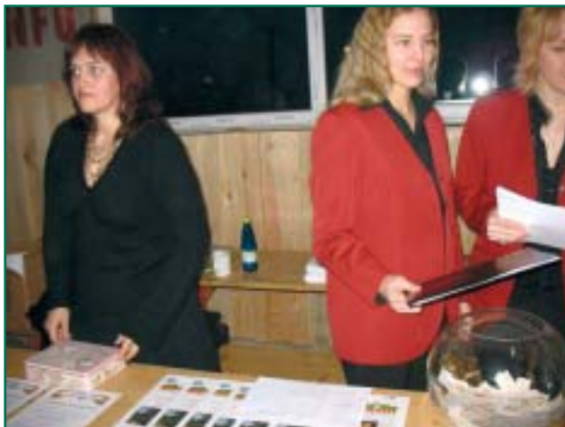
Kes soovib peokava, loosisedelit, ajalehte...