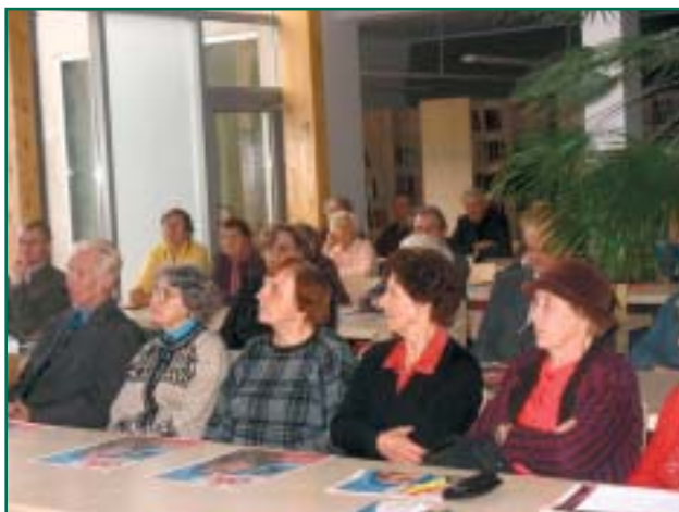
Karskusselts Võhandu 115 üritus Räpina raamatukogus.