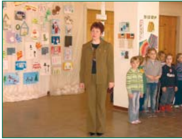
Pisikeste vallaelanike kunstinõituse avamine rahvamaja fuajees.