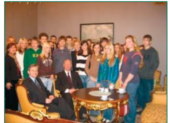
Räpina lapsi võttis vastu Riigikogu esimees Toomas Varek.