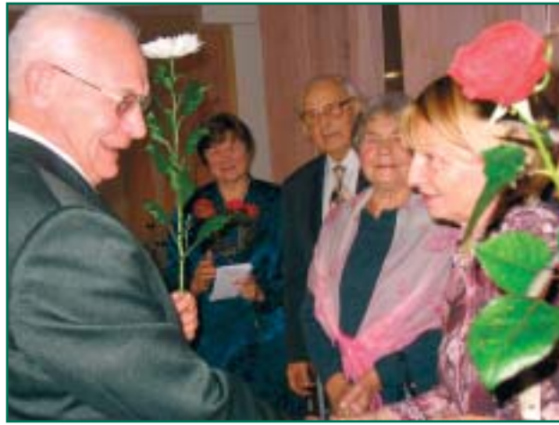
Häid ja sooje sõnu ütlesid nii endised kui praegused kolleegid.

Laps on meie kalleim vara. Teda peab õpetama ja kasvatama ennast pingutama, ületama, olema tähelepanelik ja teistega arvestav. Näiteks lapse kooli toomine ja koolist viimine autoga Räpina piirides on kuritegu lapse vastu, kuigi arvatakse, et on heategu. Probleeme koolis peab arutama koos õpetajaga, leidma ühised