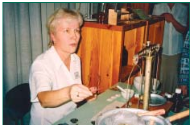
Maret oma kuningriigis pulbreid valmistamas.