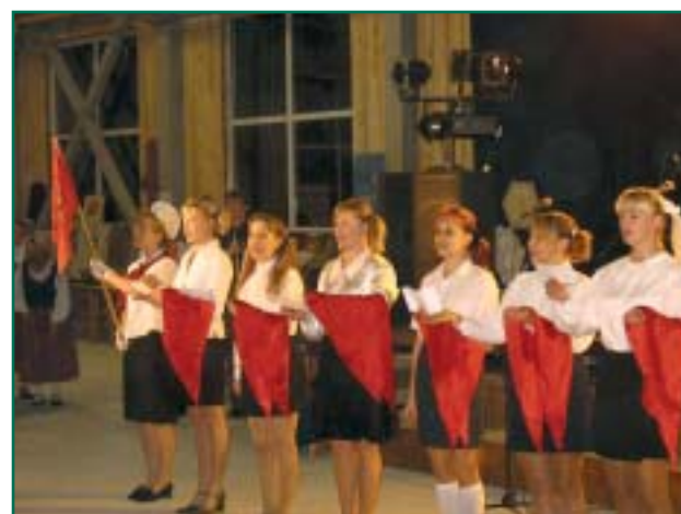
Pioneerikoonduseks valmis - alati valmis.