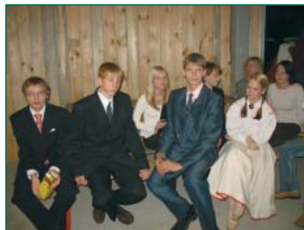
Röpina ÜG 9B klassi ansambel ootab esinemisjärge.