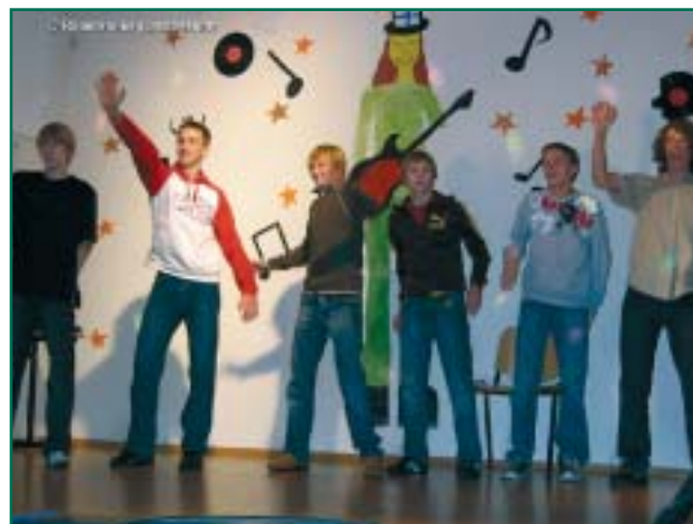
Ministaaride show ja 8B klassi poisid.