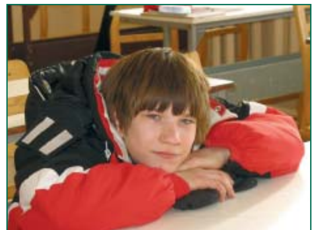
Üks ilmatu tore asi see kooliskäimine.