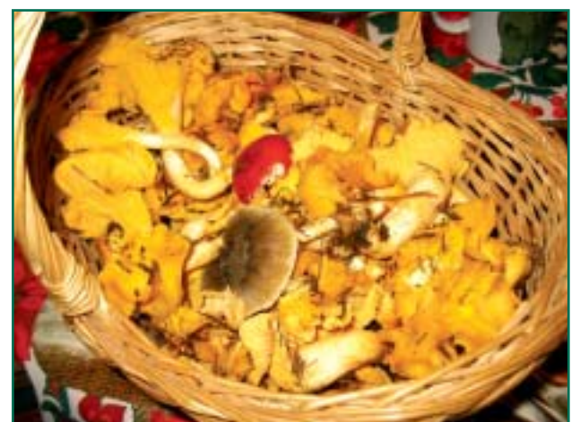
Teisel adventipühapäeval ehk 10. detsembril korjatud kuke-seened. Tea ise korjas.