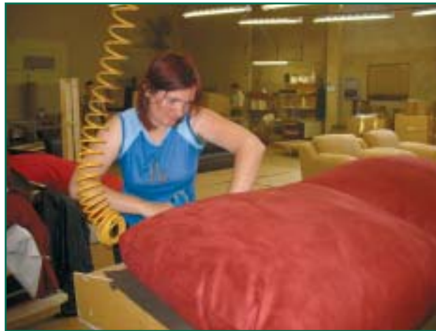
Mööblitsehhis Bellus on tööd saanud paljud vallaelanikud.