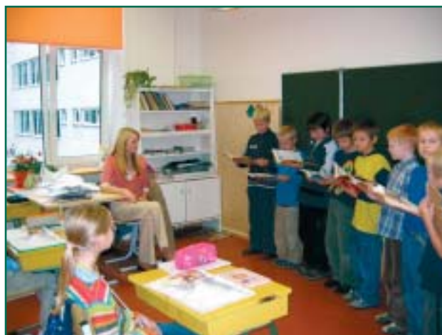
Õpetajate päev, kus tunde andsid abiturientid.