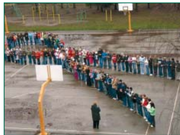
AIDS-i sumbol korvpallivaljakul.