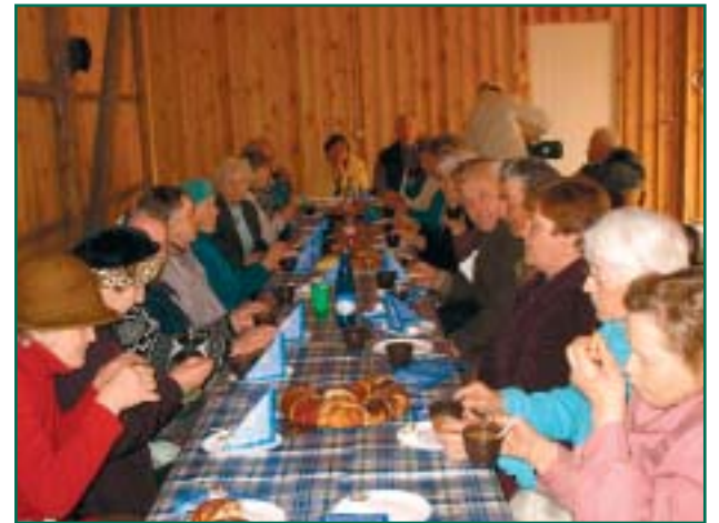
Võõpsu pensionärid peolauas.