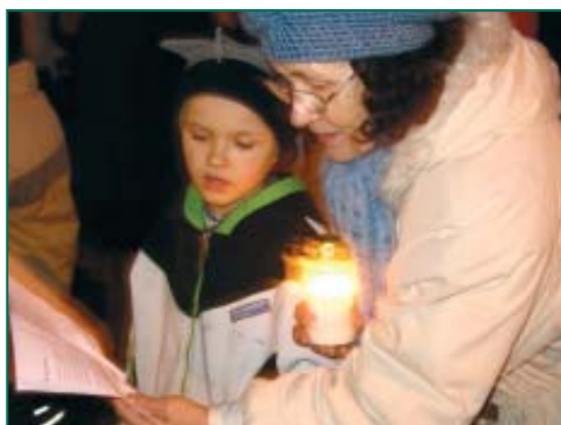
Oh, kuusepuu... laulsid nii suured kui väikesed.