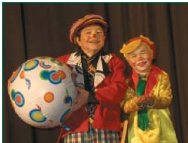
Räpinas käis liliputtide tsirkus esinemas.