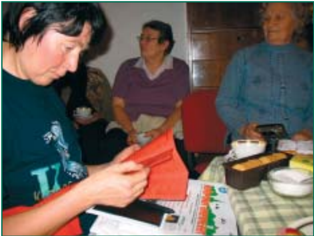
Kirjandusõhtu Võõpsu raamatukogus.