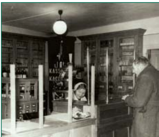
Rapina apteegis 1959. aastal.

Rapina apteek avati normaalaapteegina, 1931. a. sai asutus I jargu apteegiks, sojajargseil Voru rajooni paveil oli apteek nr. 9, seejarel apteek nr. 185, apteegid olid teadagi riiklikud. 1994. a.