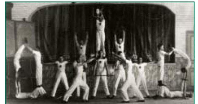
Mälestushetk spordiselt Võhandu võimleajate harjutamiselt.

Nii kadusid Ristipalol olev kungas ja Võso mäel asuv koobas kui viimsed jäljed Rápina-Lokuta Põhjasõja-aegsest lahingukohast.