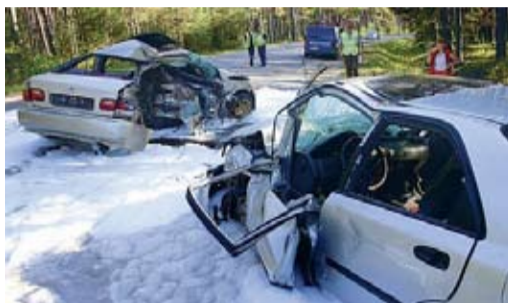
Juunis 2 inimest nõudnud liiklusõnnetus Rannamõisa teel.

Põhja Politseiprefektuuri andmetel on 2006. aasta esimese poolaastaga Harjumaal liiklusõnnetustes hukkunud 22 inimest.