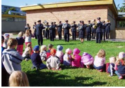
Puhkpilliorkestrit nägid paljud lapsed esimest korda

Liiklusnädala avas Tibutare lasteaias Politseiorkester. Lastele oli suureks üllatuseks, et poliitsis tegeletakse peale „päätide püüdmise“ veel pillimänguga. Nii paljude politseivormis inimeste korruga lasteaias hoois nägemine võttis lapsed algul tummaks. Kuid juba esimestest helidest saati nautisid lapsed kontserti.