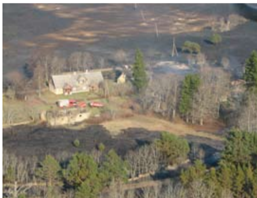
Tuli võtab valimata ja mõtlematult süüdatud kululapilt võivad saada hektarid mustunud maad või kellegi kodu suitsevad ahervaremed.

Kulu põletamisel võivad olla väga traagilised tagajärjed, seetõttu kutsub Põhja-Eesti Päästkeskus kõiki maaomanikke üles korrastama oma maavaldused juba praegu.