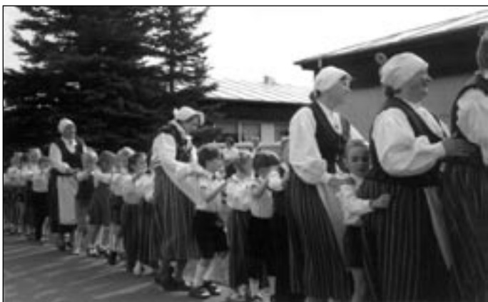
“Päsusilma” päeväku sabatants.

Mõnus on teha pidu, kui ei pea õppima uusi laule, tantse ja mängu, vaid kõik on juba ammuilma selgemast selgem. Nii mõnigi ema või isa imestas, et kuidas saavad lapsed nii palju keerulisi mängu ja laule osata. Laste jaoks pole need laulud ja mängud keerulised, vaid hoopis naljakad ja huvitavad.