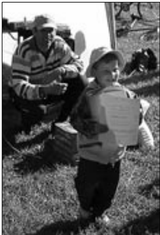
Auhinna saaja