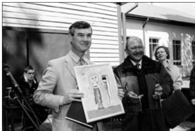
Kingitus Briti suursaadikule