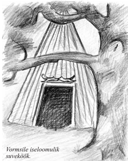
Vormsile iseloomulik suveköök.

Kui nüüd jutuga hooneid puudutada, ei anna neid kohe kuidagi kirjeldada. Kõik on nii vapustavalt ilus ja eriline, et sõnadest jääb puudu. Paljudes kohtades on õues jändrikest puudest skulptuurid