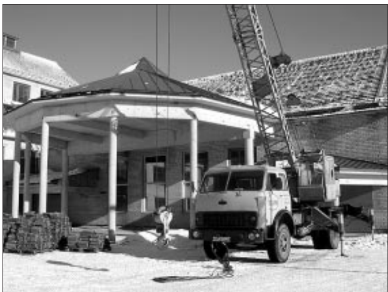
• Saali katuse ümberehitus on alanud.

Valla ülesanne on sisustada ruumid, leida kohvikupidaja ja kütte pakkaja. Kui kõik läheb plaanide kohaselt, avab rahvamaja sügisel uue hooaja uutest ruumides.