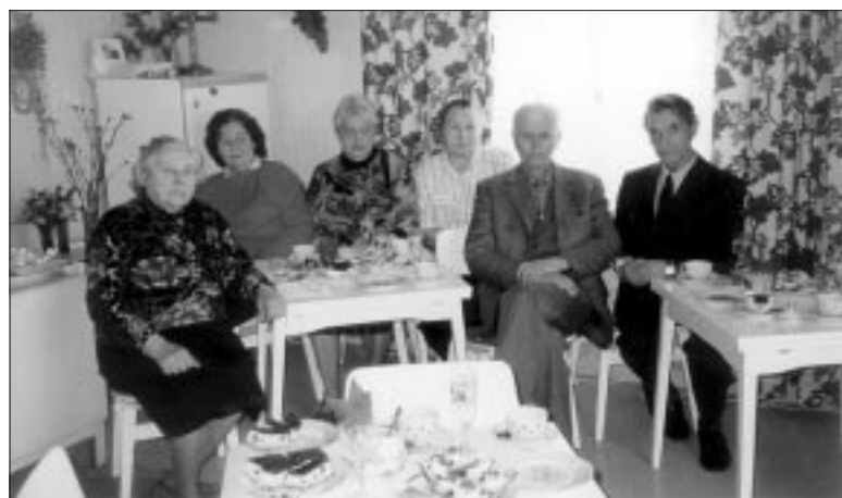
• "Kodu" juhatus "Koduköögi" sünnipäeval.