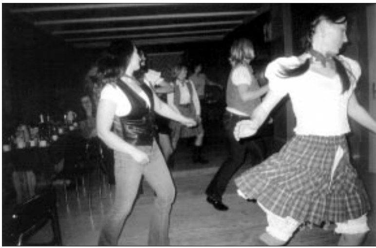
• Line-tantsijad Karksi Rahvamajas sõbrapäevaõhtul.

Karksi Vallavalitsus võtab tööle projektijuhi (0,5 ametikohta, projektide koostamine ja juhtimine). Nõutav suuline ja kirjalik inglise keele oskus. Avaldus ja CV esitada hiljemalt 20. märtsiks Karksi Vallavalitsusele Rahumäe t. 2a, 69103 Karksi-Nuia.