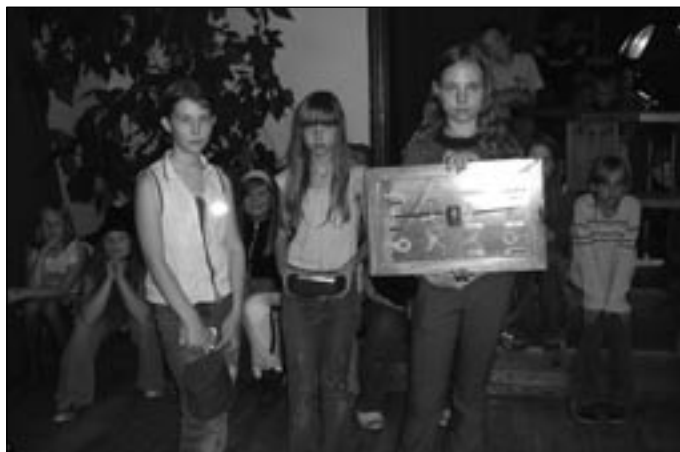
Kodanikukaitse Seltsi eriauhind Seosed.