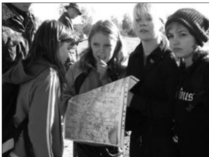
Kaardi kokkuviiimine maastikuga. Fotol Kea Karja võistkond