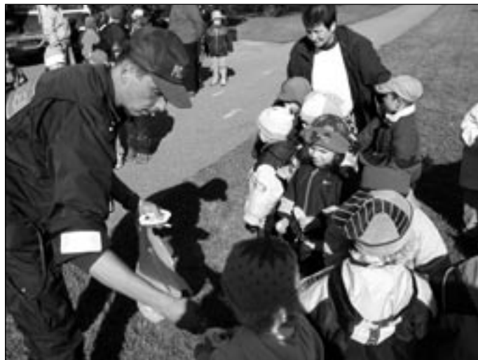
Iga laps sai Lövi Leo kleepsu ja kommi.