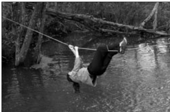
Köisteel üle jõe

Kõik osalenud võistlejad olid tublid ning jaksasid veel hilisööni tantsusaalis jalga keerutada. Täname kooli kokatädisid ja kooli osutatud abi eest! Matkamängu õnnestumist toetasid rahaliselt Eesti Haigekassa (Kodanikukaitse Seltsi projekt Oska ja julge) ning Kaitseliidu Tartu Malev. Järgmisel aastal toimub Kavilda matkamäng üle-eestilise mänguna ja rajale on oodata üle 60 võistkonna.