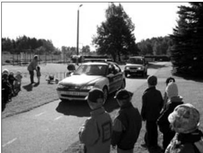
Kõik soovijad said sõita politseiautodega