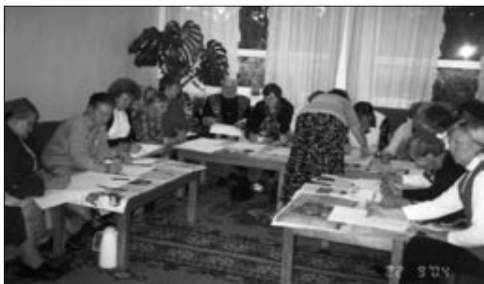
Pihlakobarat joonistamas.

Meeldiv koosviibimine on tervendav emotsioon. Suur tänu!