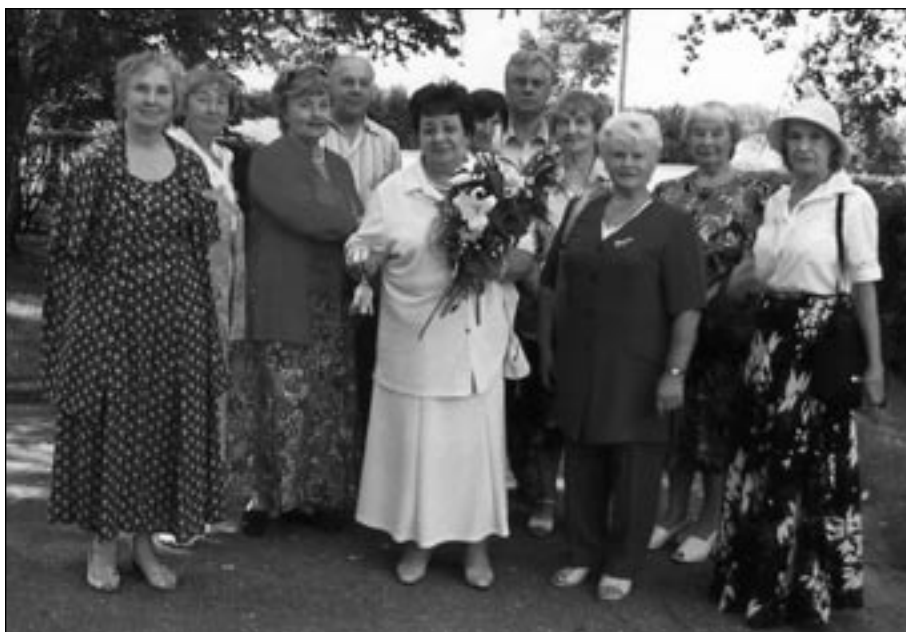
Taas me kohtusime.

Seejärel oli aeg tunnikontrolli käes 50. aasta jooksul kogutud teadmiste, saavutuste ja elutarkuse kohta. Kui tu-