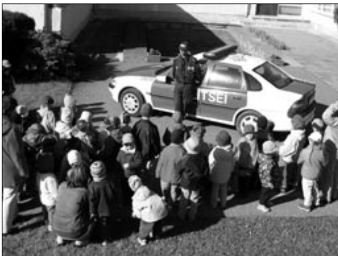
Liikluspäeval tutvustas lastele politseitööd konstaabel Alik Säde