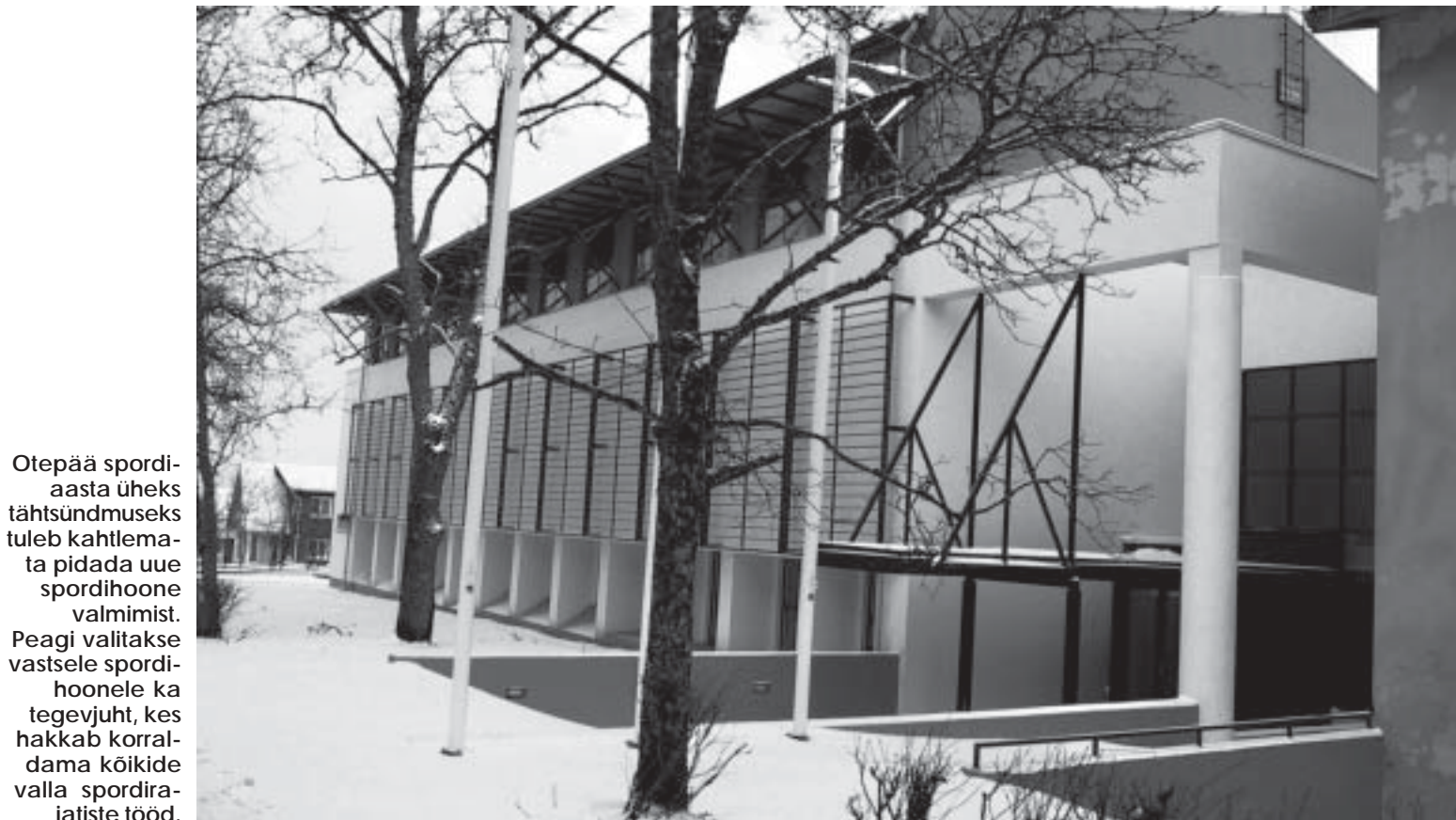
Otepää spordiaasta üheks tähtsündmuseks tuleb kahtlemata pidada uue spordihoonel valmimist. Peagi valitakse vastsele spordihoonel ka tegevjuht, kes hakkab korraldama kõikide valla spordirajatiste tööd.

MAIS on mitmel viimasel aastal Otepää olnud kohtumispäevaks jooksjatele ning ratturitele. Sellelgi aastal anti Tehvandi suusastaadionilt start Tartu nelikürituse avaalale – 23km pikkusele jooksumaratonile. 2 nädalat hiljem läbisid Otepääd Tartu rattaralli osalejad. Mai-kuus võisid taas rõõmustada ko-