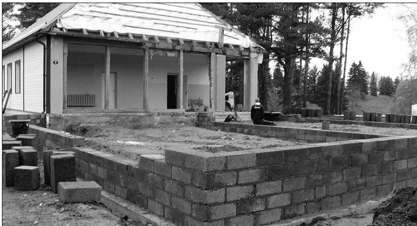
● Lasteaia ehitus käib täie hooga.