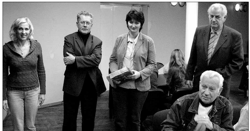
• Esimese voo võitjad.