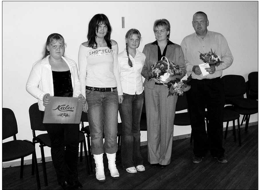
● Jõemaad on 2006. aasta Valla Pere.