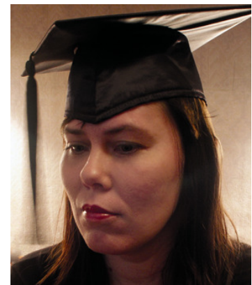
EBS I traditsioonide hulka kuulub kollilõpetajate ameerikalik riietus koos mütsiga

kondlike arengutest. Arenguid on jälgitud läbi sotsiaalse kapitali teooria. Lõputöös on analüüsitud eesti meedia rolli soolise võrdõiguslikkuse teema käsitlemisel ning lugejate suhtumise muutumist viimase paari aasta jooksul ja leitud, et olukord Põhjamaades siis, kui naisõiguslus esimesi samme tegi ja praegu meil, on vägagi erinev ja seetõttu vajab ka teistsugust lähenemist.